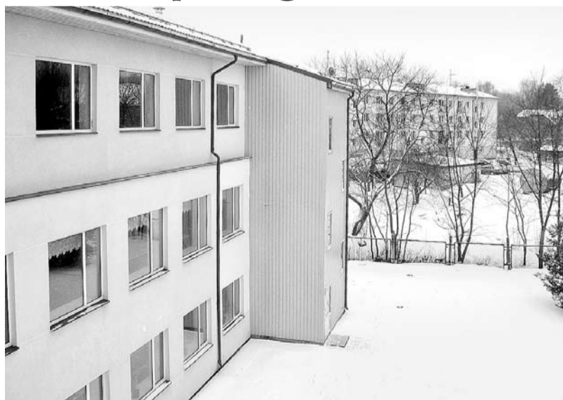
1. vidusskolas invalīdu pacelēja piebūve.