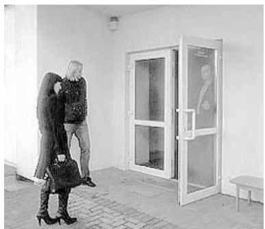
Izbūvētais panduss skolas stadiona pusē ar projekta auditoriem.