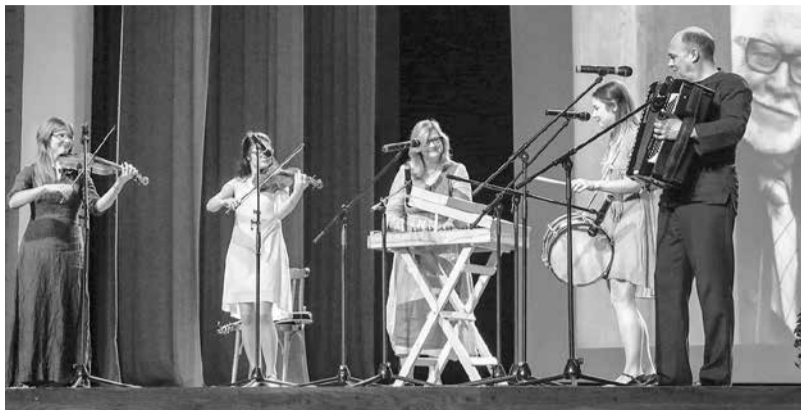
Dziedošā un muzicējošā Igaņu ģimene 2017. gada "Spietā" Madonā.

Sagaidot 18. novembri, mūsu Latvijas 100. jubileju, sirsnīgi sveicu visas Madonas novada un