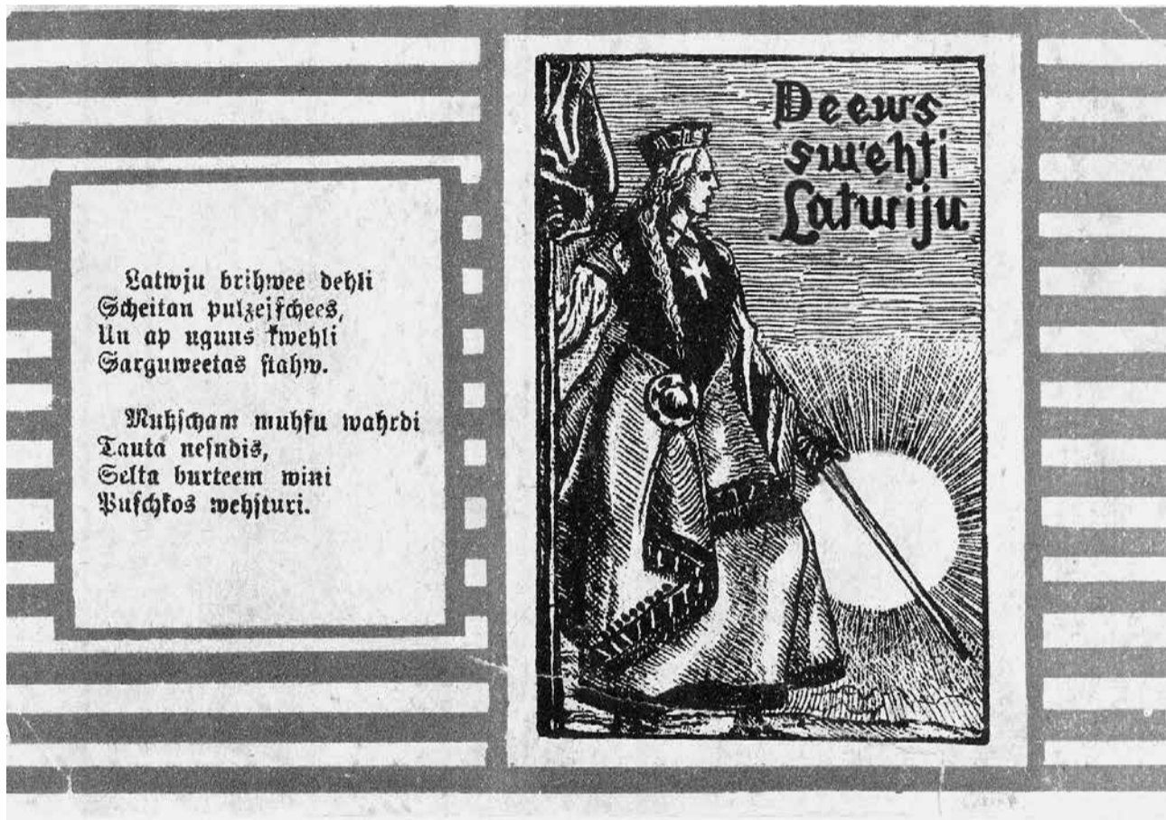
Atklātne no Madonas muzeja krājuma. Sūtīta 1918. gadā.

Viens no trim valsts simboliem ir himna – pacilājoša, svinīga slavinājuma dziesma. Termins “himna” cēlies no sengrieķu vārda “hymnos” – “aust”.