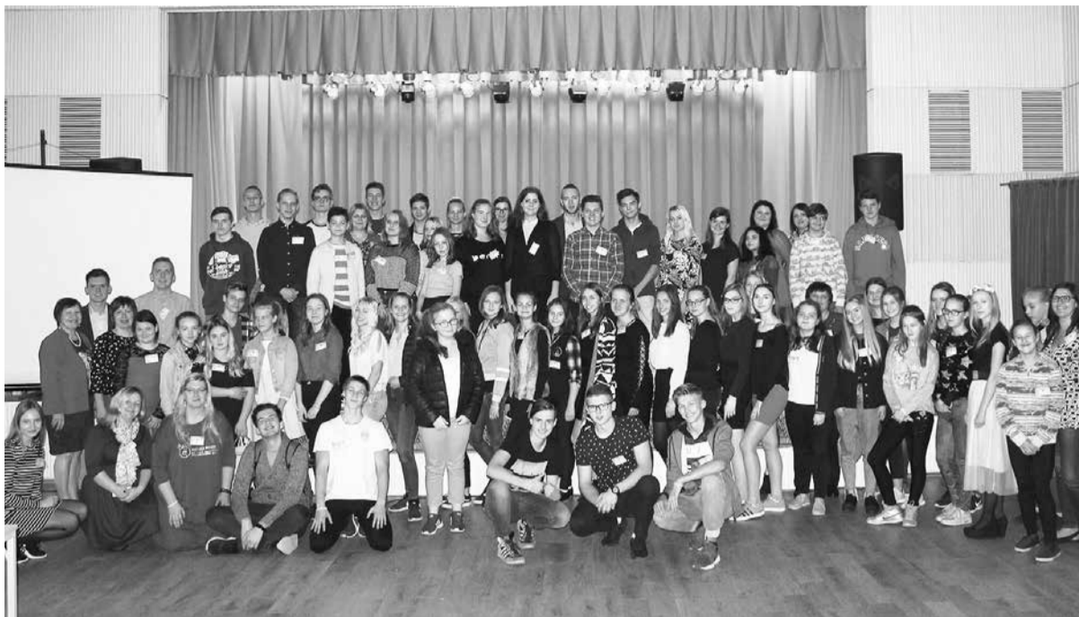
Iniciatīvas bagātākie jaunieši un jaunatnes darbā iesaistītie.

Izprast jauniešu lomu, vērtību un iespējas dažādu līmeņu pašvaldībās palīdzēja izzinošas akti-