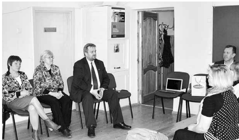
Laika posmā no marta sākuma līdz aprīļa vidum novada deputāti ir tikusies kopumā ar aptuveni divarpussimtu iedzīvotāju. Lielākā iedzīvotāju atsauce bija Barkavā, mazākā – Lazdonā.