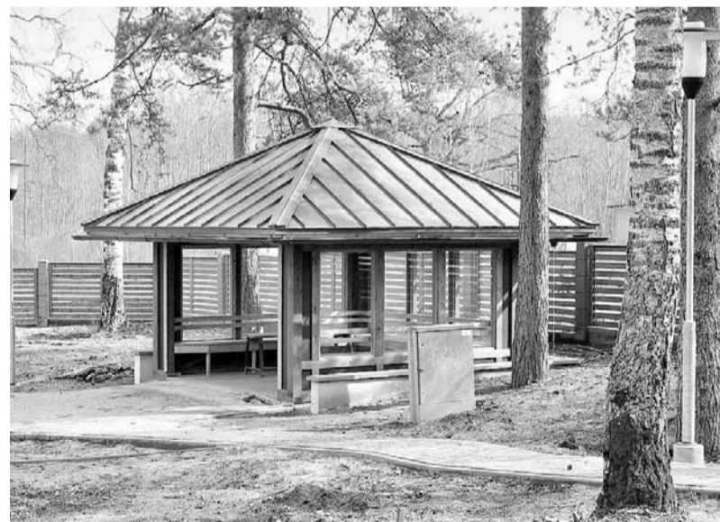
Aiz pansionāta ēkas izveidotajā atpūtas zonā vietu atradusi mājīga lapenīte.