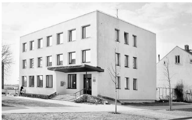
Biznesa inkubators "Ideju ceļš" atradīsies Blaumaņa ielā 3, Madonā.

Inkubators atradīsies pašvaldībai piederošās ēkas Blaumaņa ielā 3 telpās. Šobrīd tajās ar Madonas novada uzņēmēju atbal-