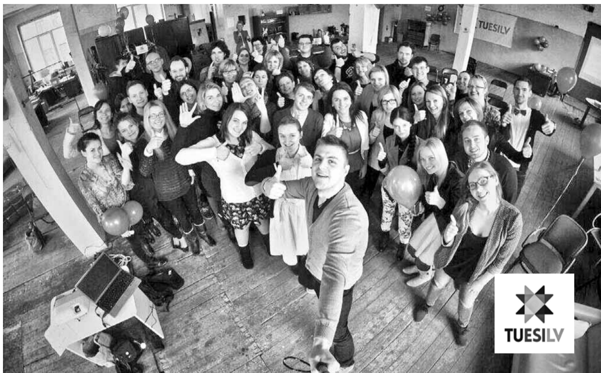
Projekta "TU.ESI.LV" uzsākšanas semināra dalībnieku kopīgā fotogrāfija Ģertrūdes ielas teātrī, Rīgā. Visi jūtas iedvesmoti no dzirdētajiem stāstiem.

Nav noslēpums, ka liela daļa jauniešu par savu dzīves vietu izvēlas lielās pilsētās. Tāpēc, lai mudinātu jauniešus dzīvot, strādāt un atpūsties Latvijas reģionos, tika izveidots un tikko uzsāks projekts "TU.ESI.LV".