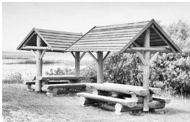
Jaunas atpūtas vietas iekārtotas arī pie Lubāna Mitrāja informācijas centra.