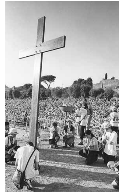
Lūgšana pie krusta Romā 2000. gadā.