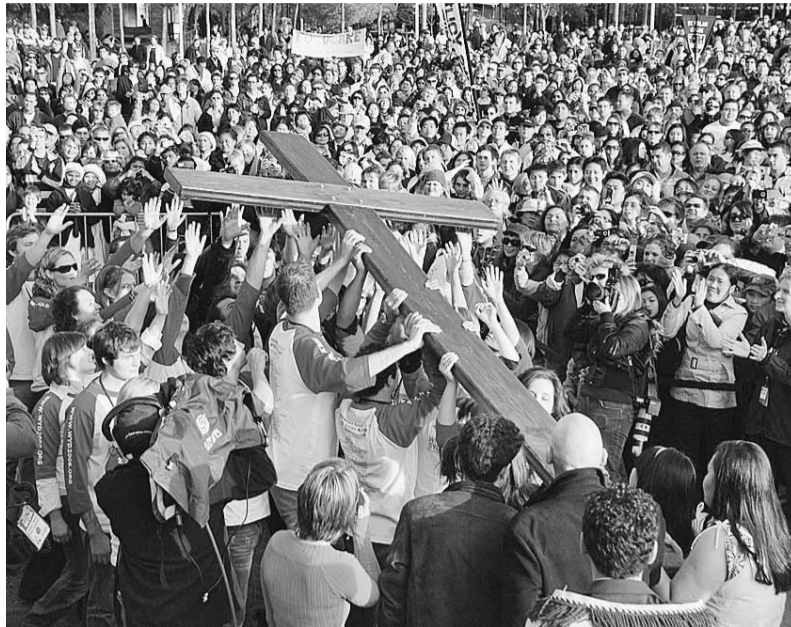
Pasaules Jauniešu dienas Sidnejā Austrālijā.