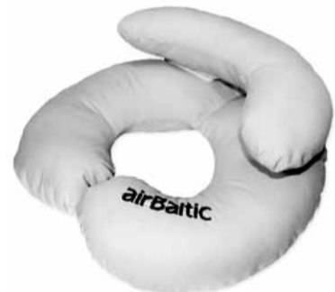
SIA “Dream Sleep” ceļojumu spilvens.

Vieni no veiksmīgākajiem konkursa dalībniekiem ir SIA “Dream Sleep”, kuri biznesa laucīnā sāka darboties, būdami vidusskolā. Viņu ražotā produkcija ir atzīta ne tikai novadā, bet arī ārpus tā. “Dreamsleep” ražo patentētus unikāla dizaina ceļojumu spilvenus. SIA “Dream Sleep” jau piedāvā savu produkciju “AirBaltic” katar-