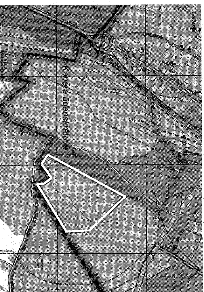
Sagatavoja IONA GLEIZDE, Madonas novada pašvaldības Attīstības nodaļas teritorijas plānotāja

Lokālplānojuma nekustamajam īpašumam Bērzu ielā 27, Madonas pilsētā, Madonas novadā, kadastra apzīmējums 70010011693, kas groza Madonas novada teritorijas plānojumu, robežas