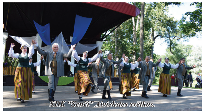
SDK “Senči” Aiviekstes svētkos.

9. jūlijā senioru deju kolektīvs “Senči” kuplināja “Aiviekstes svētku” koncertu Lubānā.