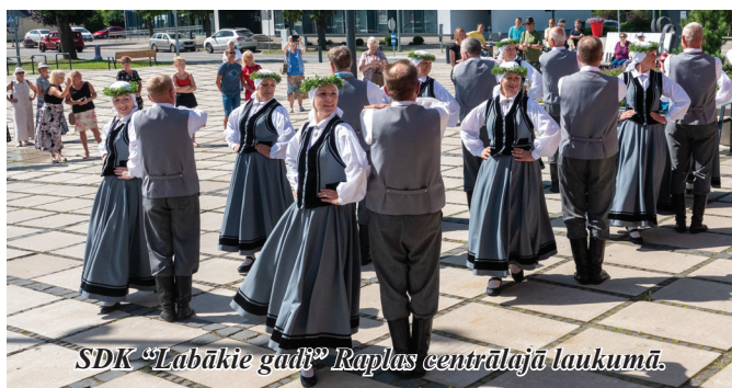
SDK “Labākie gadi” Raplas centrālajā laukumā.

30. jūlijā vokālis ansamblis “Rondo” kuplināja Ērgļu pagas- ta svētkus.