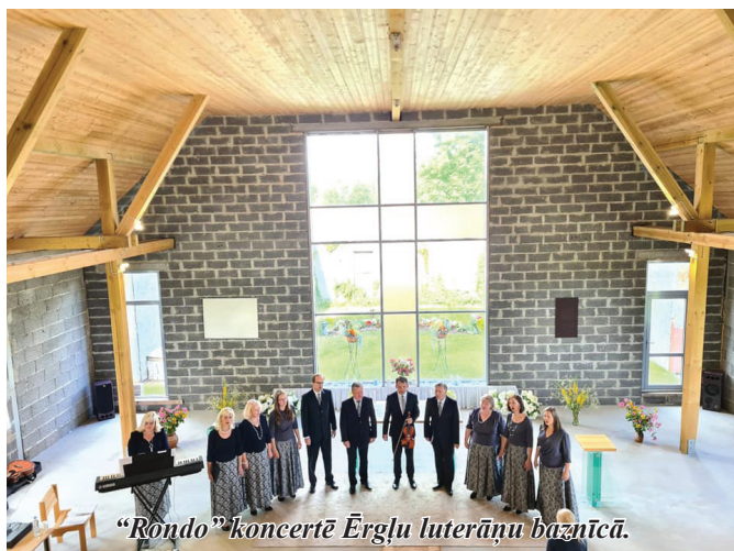
“Rondo” koncertē Ērgļu luterāņu baznīcā.

30. jūlijā vokālis ansamblis “Rondo” kuplināja Ērgļu pagas- ta svētkus.