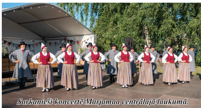
Sarkanieši koncertē Marjamaa centrālajā laukumā.

No 4. līdz 7. augustam senioru deju kolektīvs piedalījās starptautiskajā folkloras festivālā “Marjamaa folk” Igaunijā. Ar savu dejas soli kolektīvs priecēja igauņus Marjamaa pilsē- tas laukumā, piedalījās gājienā un noslēguma koncertā estrādē.