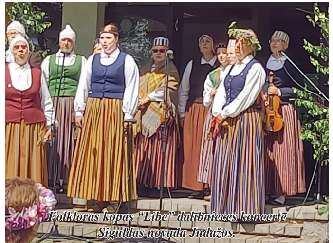
Folkloras kopas “Libe” dalībnieces koncertē Siguldas novada Judažos.

7. jūlijā daļa folkloras kopas “Libe” piedalījās starptautiskā folkloras festivāla “Baltika” atklāšanas koncertos Siguldas novada Judažos un lielkoncertā Turaidā.