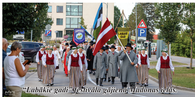
“Labākie gadi” festivāla gājienā Madonas ielās.

Tāpat koncertēja Raplas centrālajā laukumā kopā ar ukraiņu deju kolektīvu.