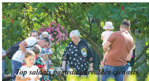
Top saldais pagasta pārvaldes cienasts