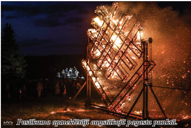
Pasākuma apmeklētāji augstākajā pagasta punktā.