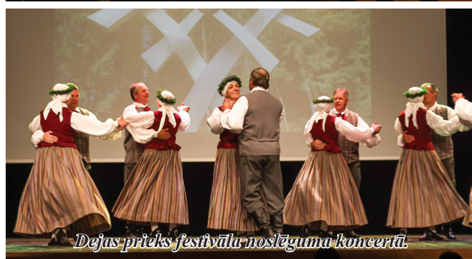
Dejas prieks festivāla noslēguma koncertā.

No 19. līdz 21. augustam Madonas novadā notika starptautiskais amatiermākslas festivāls “Rotā, saule, rietēdama”, kurā piedalījās deju kolektīvs “Labākie gadi”. Kolektīvs kopā ar savu ilgstošo sadraudzības kolektīvu “Hopsani” koncertēja Biksēres estrādē, Mārcienā, Sauleskalnā un piedalījās svētku gājienā un noslēguma koncertā Madonā.