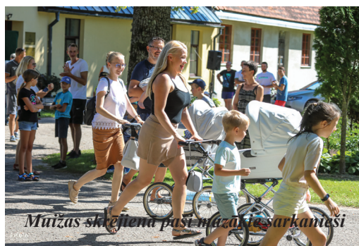
Muižas skrejienā paši mazākie sarkanieši

Valdas Kļaviņas teksts