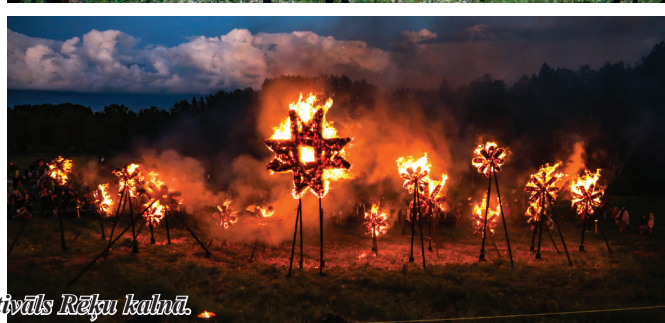
Ugunsskulptūru festivāls Rēķu kalnā.