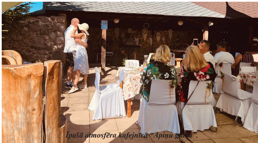
Īpašā atmosfēra kafejnīcā "Apiņu gūstis".