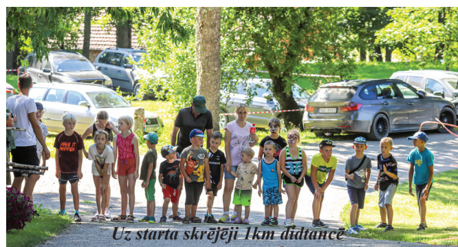
Uz starta skrējēji 1km distancē