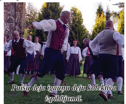
Puišu deju igauņu deju kolektīva izpildījumā.

29. jūlijā pasākumu cikla ceturtajā koncertā apmeklētājus priecēja pazīstamais saksofonists Raivo Stašāns, savukārt pirms šī koncerta skatītājus ar savām dejām priecēja igauņu deju kolektīvs.