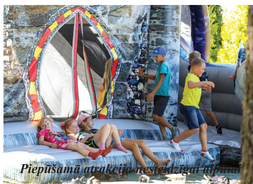
Piepūšamā atrakcija nesedzīgai atpūtai