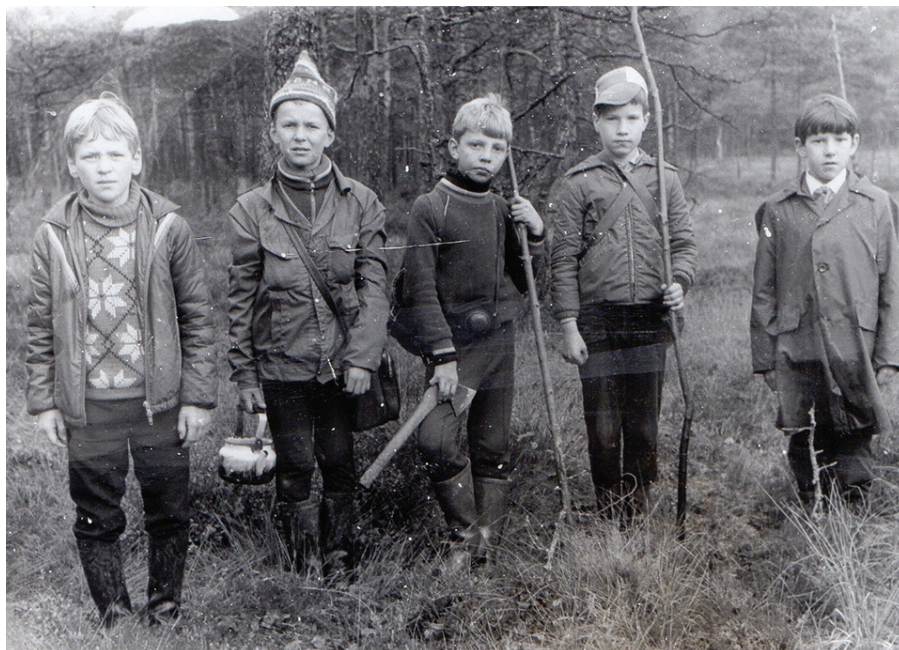
Pie Rāvijas ezera. Izraudzīti koki tējas katliņa pakāršanai, tūristu cirvītis lieliski noderējis.