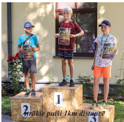
Ātrākie puīši 1km distancē