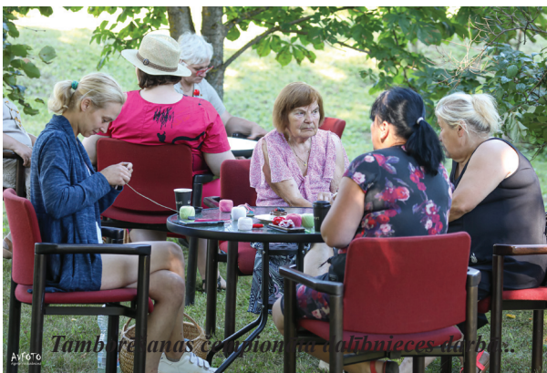
Tamborēšanas Čempionāta dalībnieces darbā.