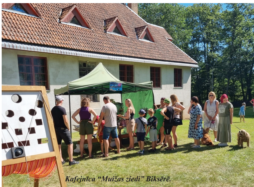
Kafejnīca “Muižas ziedi” Bikšērē.