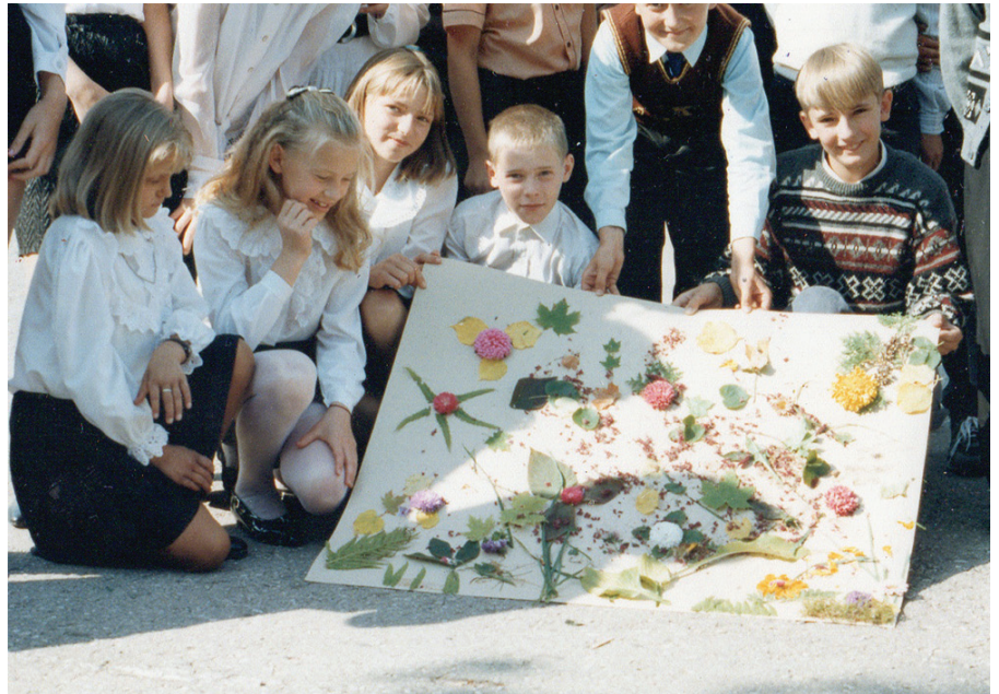
7. klases radošais veikums pirmajā skolas dienā 1996. gadā.

1990. gadi ienes pārmaiņas ar kādu radošu darbošanos pirmajā skolas dienā un fotografēšanos pa klasēm, Miķeļdienas tirdziņu un rudens velšu izstādi "Rudentiņš – bagāts vīrs" visradošākajās izpausmēs. Var jau būt, ka iesākums šai tradīcijai ir sens, jo skolotāja A. Lībore savās atmiņās "Mani gaišie skolas gadi Sarkaņos" (par 1939. līdz 1941. gadu) savulaik rakstīja: "Ik rudenis notika ražas skates, kur katrs varē-