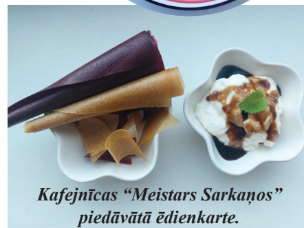
Kafejnīcas "Meistars Sarkaņos" piedāvātā ēdienkarte.

kāds ir mūsu nelielā uzņēmuma galvenais darbības virziens ikdienā. Mēs piedāvājām veģetāros ēdienus. Mūsu viesi varēja nobaudīt kartupeļus ar pildījumu, nātru čipsus, biezpiena pudīņu ar dažādiem sīrupiem (piparmētru, pelašķu, vīgriezes u.c.), tāpat augļu, dārzeņu vafeles, ozolziļu kafiju un fermentētu ugunspuķes tēju.