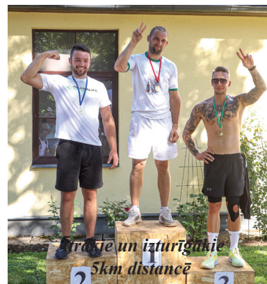
Ātrākie un izturīgākie 5km distancē