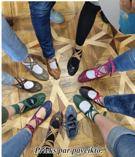
Prīeks par paveikto.

Rūdolfs ar talkā atrasto neparasto kartupeli.