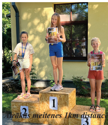
Ātrākās meitenes 1km distancē