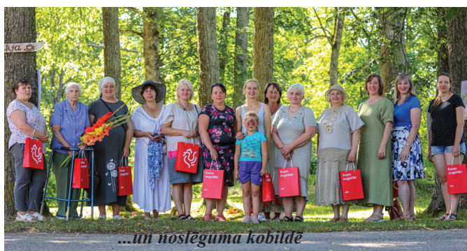
...un noslēguma kobilde