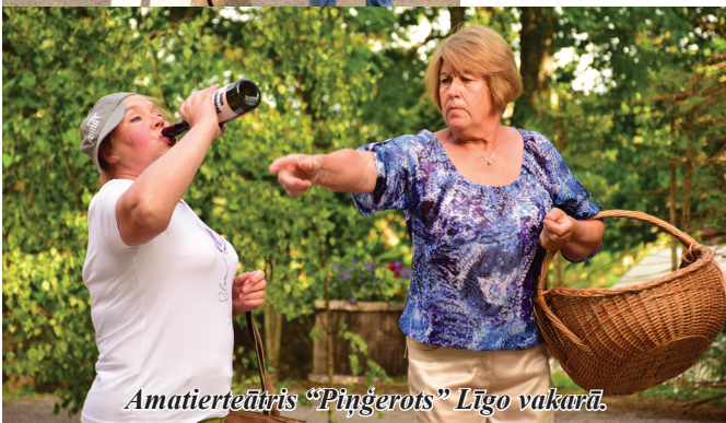
Amatiereteātris “Piņģerots” Līgo vakarā.