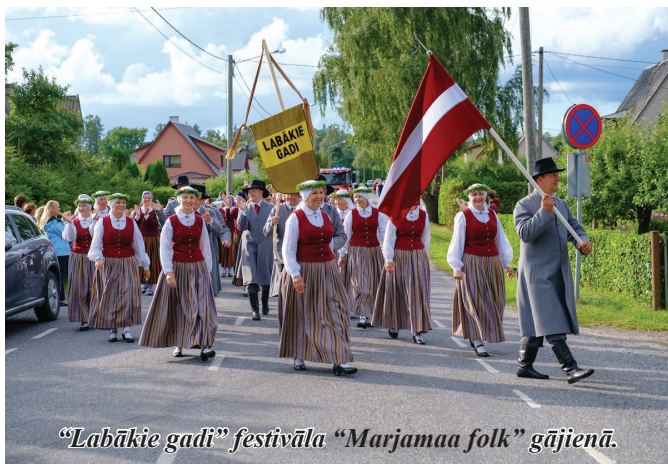
“Labākie gadi” festivāla “Marjamaa folk” gājienā.