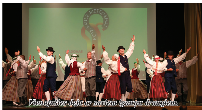
Vienojušies dejā ar saviem igauņu draugiem.