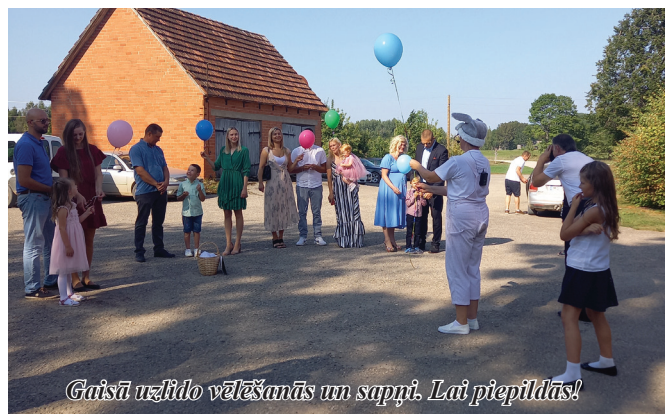
Gaisū uzlido vēlēšanās un sapņi. Lai piepildās!

No 19. līdz 21. augustam Madonas novadā notika starptautiskais amatiermākslas festivāls “Rotā, saule, rietēdama”, kurā piedalījās deju kolektīvs “Labākie gadi”. Kolektīvs kopā ar savu ilgstošo sadraudzības kolektīvu “Hopsani” koncertēja Biksēres estrādē, Mārcienā, Sauleskalnā un piedalījās svētku gājienā un noslēguma koncertā Madonā.