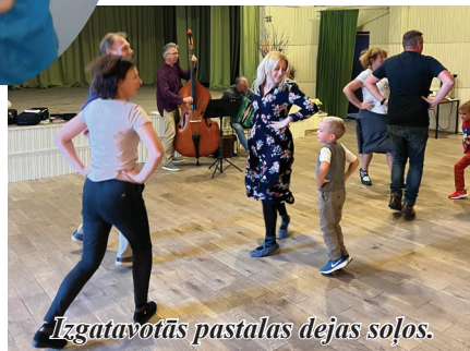
Izgatavotās pastalas dejas soļos.