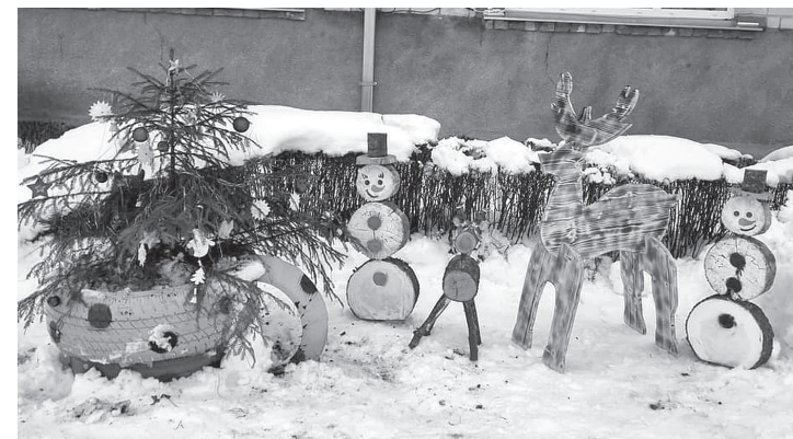
Ziemassvētku konkursa uzvarētājs.