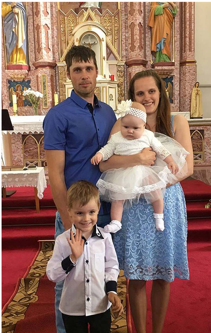
Kopā ar ģimeni.

Uz dzīvi un lietām mēģinu skatīties pozitīvi, neieslīgt problēmās. Galvenais, lai mums apkārt būtu čakli un smaidīgi cilvēki, kuri savu darbu darītu ar atbildības sajūtu. Nākotnē pagastā vēlētos vairāk iedzīvotāju un pilnākas klases skolā, bet