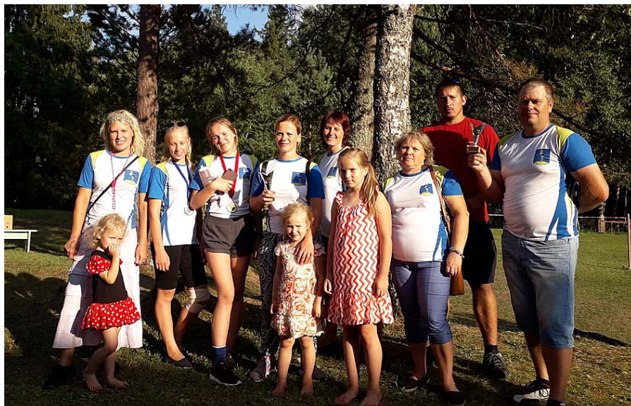
Mūsu pagasta dalībnieki.