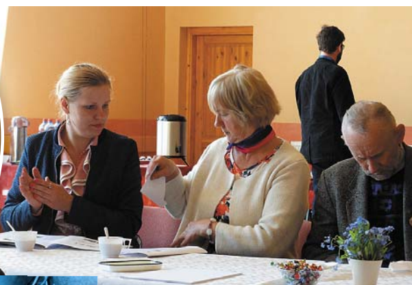
Kopā ar „Klānu vēstis” komandu Liezērē, avīznieku tikšanās reizē.