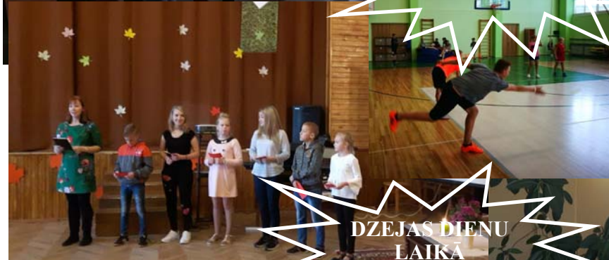
DZEJAS DIENU LAIKĀ