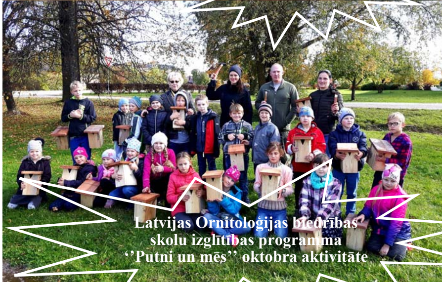
Latvijas Ornitoloģijas biedrības skolu izglītības programma "Putni un mēs" oktobra aktivitāte

Avīzi veidoja : S.Šķēle, E.A.Ločmele, E.Bormane Datorsalikus sk. I.Strode