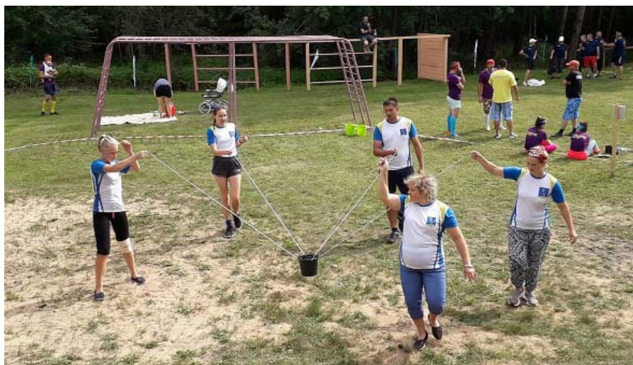
Vienā no aktivitātēm.

Šogad, 18. augustā, Mārcienā norisinājās ikgadējās Madonas novada pārvalžu sporta spēles. Ošupes pagasts katru gadu cenšas sevi pārstāvēt godam un, kā katru gadu, iegūtas ir arī medaļas.