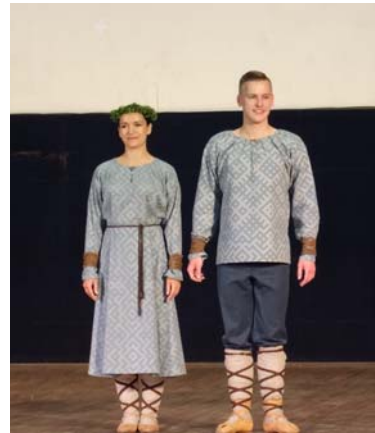
Šādi tērpi iecerēti visiem kolektīviem Deju lieluzvedumā.

kiem, kas 2017. gada 17. – 18. jūnijā notiks Ventspils olimpiskajā centrā.