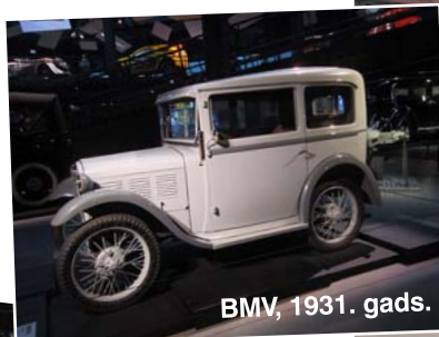
BMW, 1931. gads.

Apzinoties šo pagātnes un nākotnes ciešo savstarpējo sasaisti, dāmu klubiņš nolēma apmeklēt vietu, kur grāmatās atspoguļotie sapņi pāraug īstenībā. Līdzīgi kā Žila Verna romānos, kuros tika aprakstīti