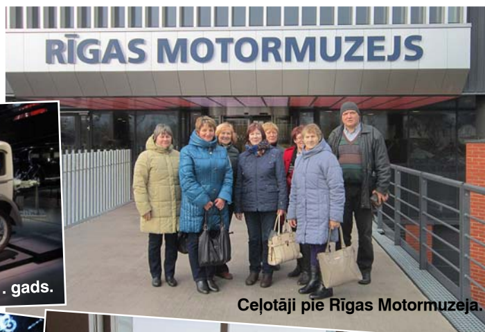
Ceļotāji pie Rīgas Motormuzeja.