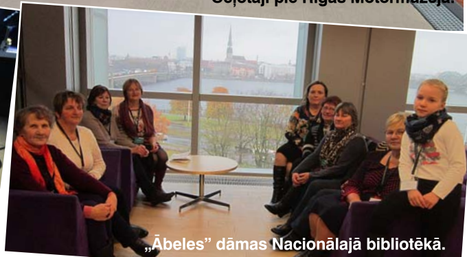
„Ābeles” dāmas Nacionālajā bibliotēkā.

pa gaisu lidojoši un zem ūdens peldoši transporta līdzekļi, kas tajā laikā bija kaut kas nedzirdēts – tīrā fantāstika, rosinot jaunā lasītāja iztēli un sapņus, kas, pateicoties zināšanām, vēlāk pārtapa mums tagad tik zināmā tehnikā.