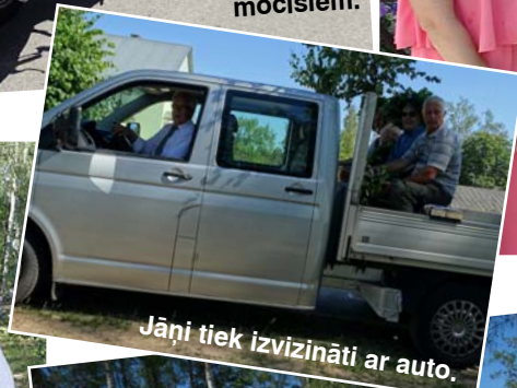
Jāņi tiek izvizināti ar auto.