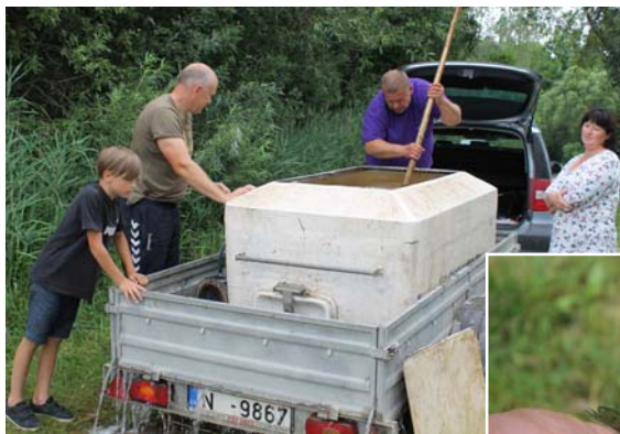
Atvesti zivju mazuļi