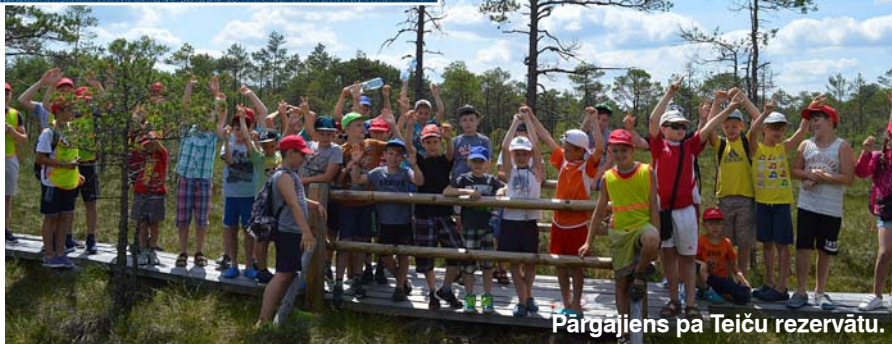
Pārgājiens pa Teiču rezervātu.