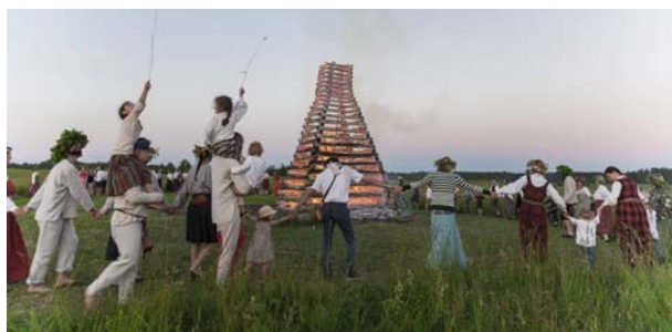
Ap Jāņu lielo ugunsroku „Brīvniekos – Kolbergos” gāja rotaļās.