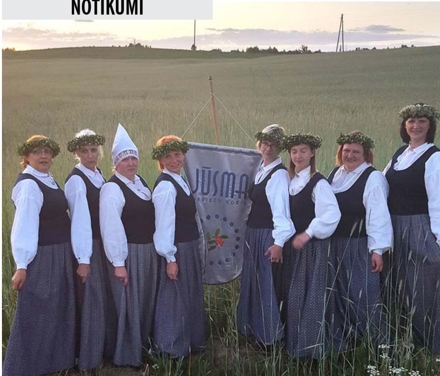
Jūsma meitenes pēc koncerta.

Es bij' meita, man bij' vara... ar tādu pārliecību dziedam mēs – Jūsma, un ar tādiem vārdiem sākas Kārļa Lāča dziesma.