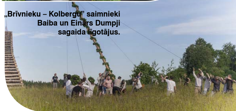
Vajadzīgs liels spēks, lai taptu gaisma.