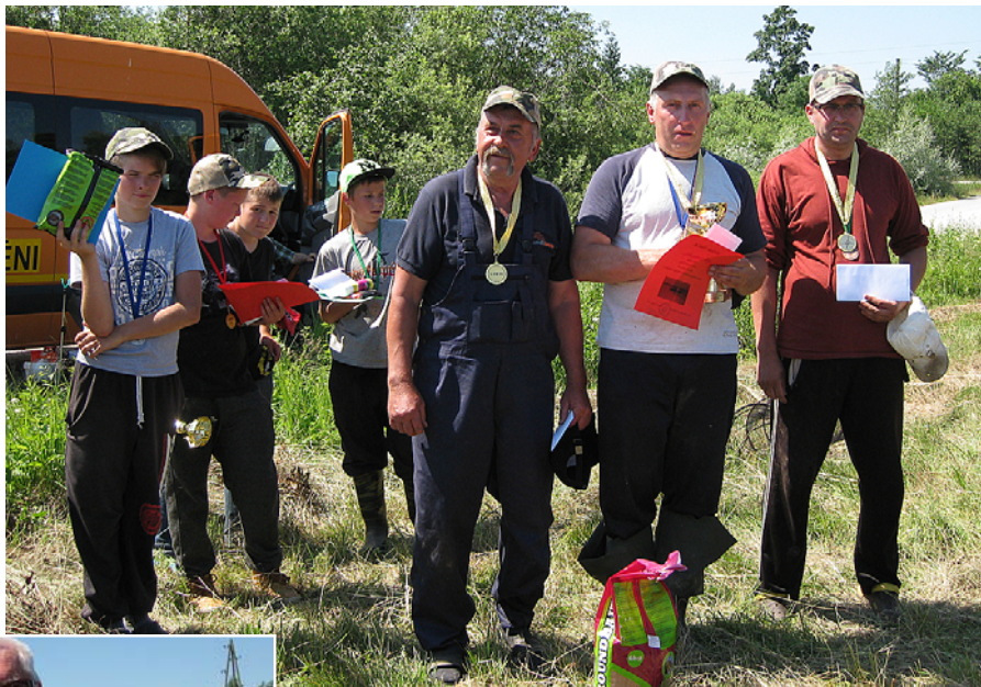
Uzvarētāji – Kalsnavas komanda.