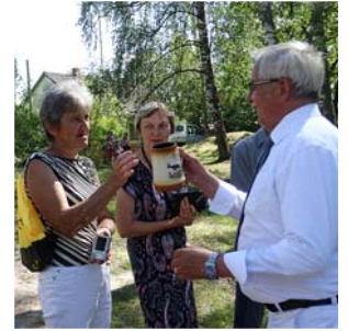
Pārvaldes vadītājs cienā ar Jāņu alu.