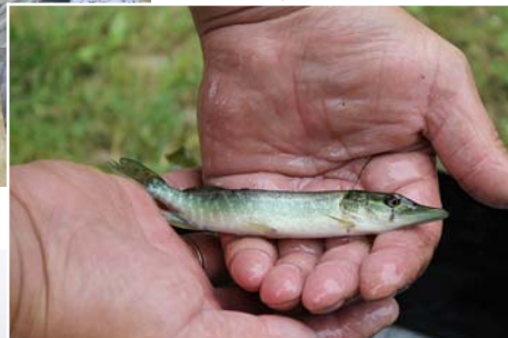
Ezerā ielaistas mazas līdaciņas.