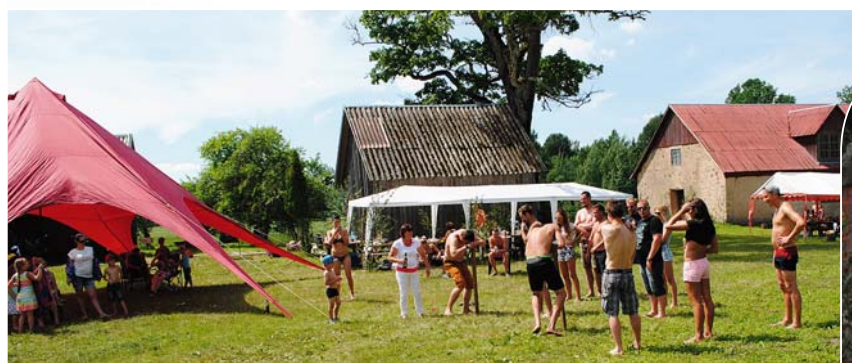
Svētku atrakcijas Aizezerē sit augstu vilni.