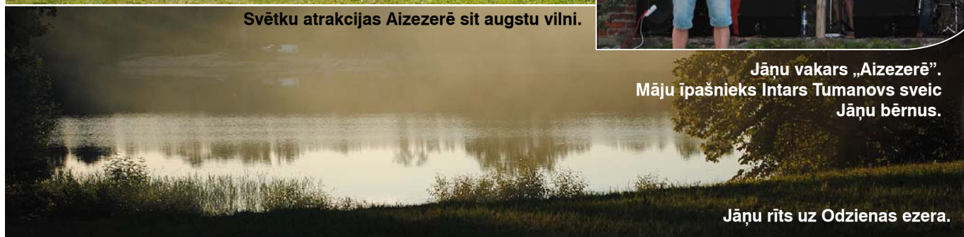
Jāņu rīts uz Odzienas ezera.