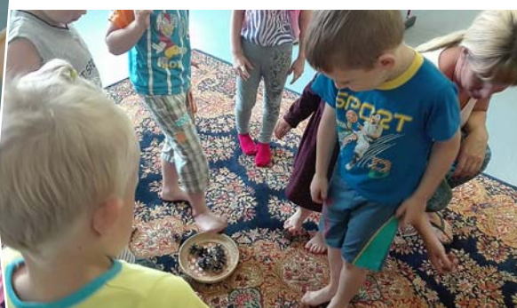
Pārbaudījums mazajām pēdiņām.