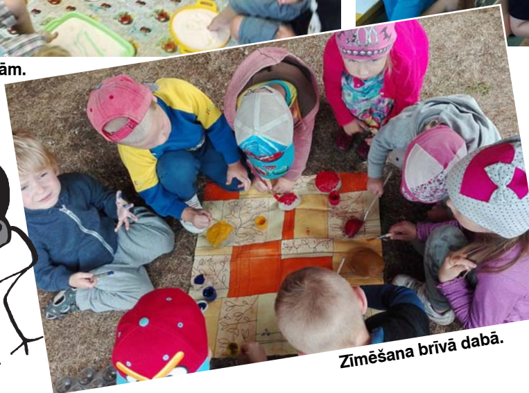
Zīmēšana brīvā dabā.