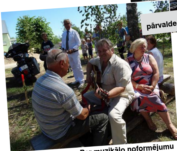
Par muzikālo noformējumu rūpējas mūziķis no Madonas.