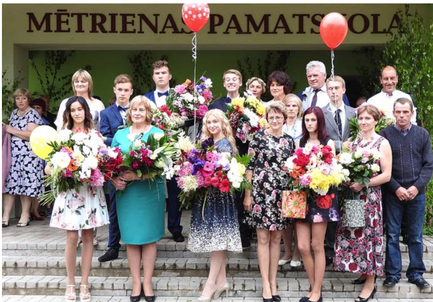
Absolventi kopā ar vecākiem un skolotājiem.

Izver sapni caur saules staru Garu, garu Un saki pats sev „Visu varu!” Met savu sapni ugunī, Topi tās liesmā par dziesmu Un saki pats sev „Tālu iešu!” Tikai neļauj sapnim sasalt, Sapnim skanīgam, baltam! Bez sapņa nav spēka dzīvot, Un cilvēks bez ceļa var nosalt.