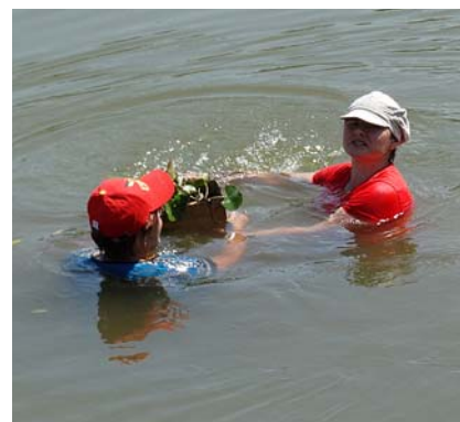
Stādīņš tiek ielaists ūdenī.