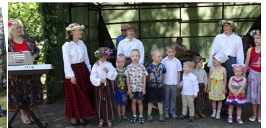
Līgo dziesmas dzied Mētrienas pamatskolas pirmsskolas grupiņas audzēkņi.