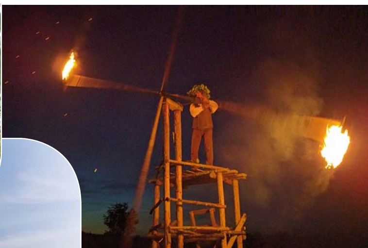
Gaismas spēles Eināra Dumpja izpildījumā.