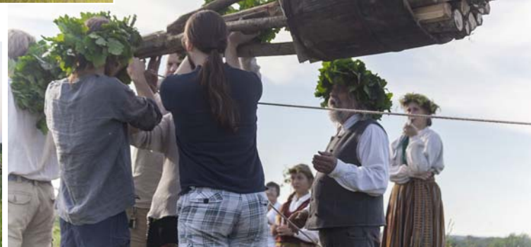
Top Jāņu uguns.