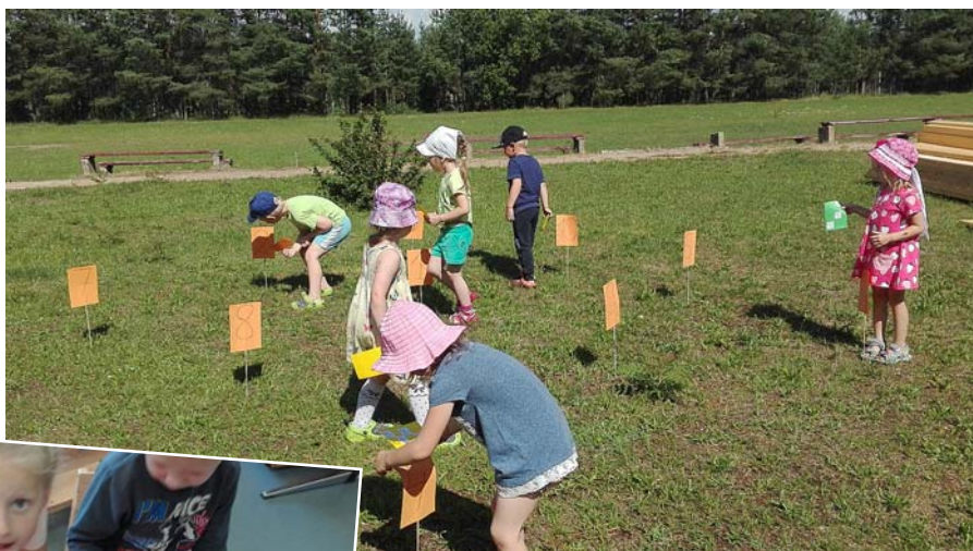
Jāatrod pareizais cipars.