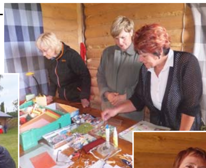
Darbojamies radošajā darbnīcā.