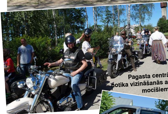
Pagasta centrā notika vizināšanās ar mocišiem.