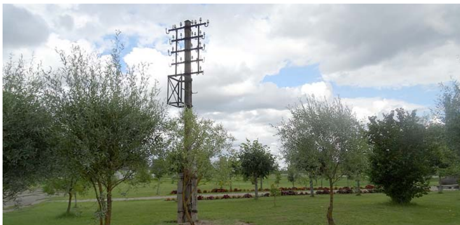
Gaismas stabs pie Piemiņas akmens.