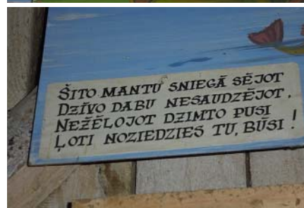
Uzraksti darbarīku muzejā.