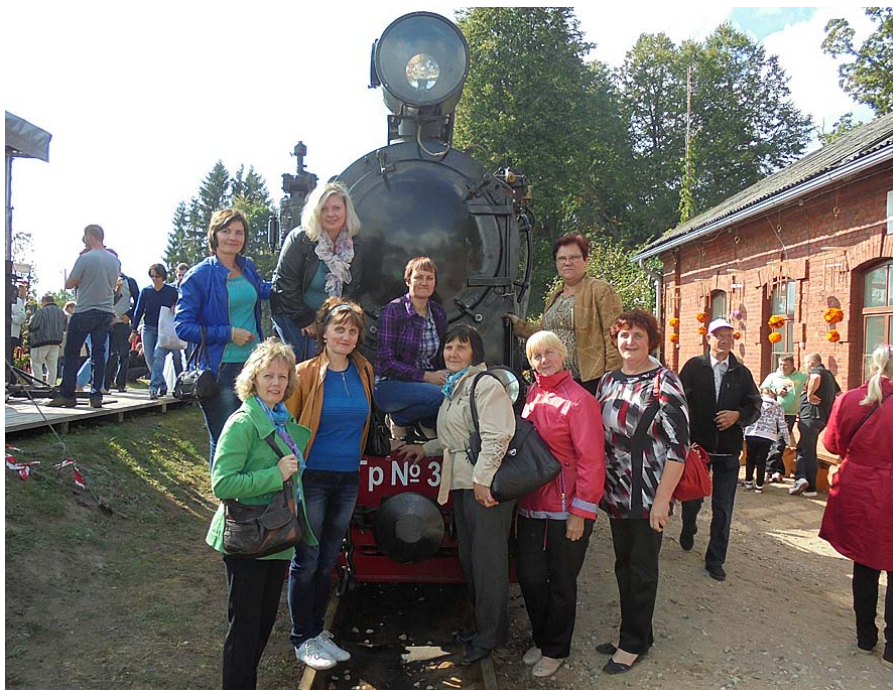
Iepozējam ar „Ferdinandu”.

gadus ēka vispār netika izmantota. Kopš 1998. gada Stāmerienas pili, parku un divas saimniecības ēkas apsaimnieko SIA „Zeltaleja 1”. Šajā laikā veikti nepieciešamākie darbi, lai novērstu ēku bojāeju. Arī parkā tiek veikti regulāri kopšanas darbi. Nu Stāmerienas parks ir viens no vislabāk koptajiem vēsturiskajiem parkiem Gulbenes rajonā. Pils ir atvērta publikas apmeklējumiem, interesentiem tiek piedāvātas arī gida vadītas ekskursijas.