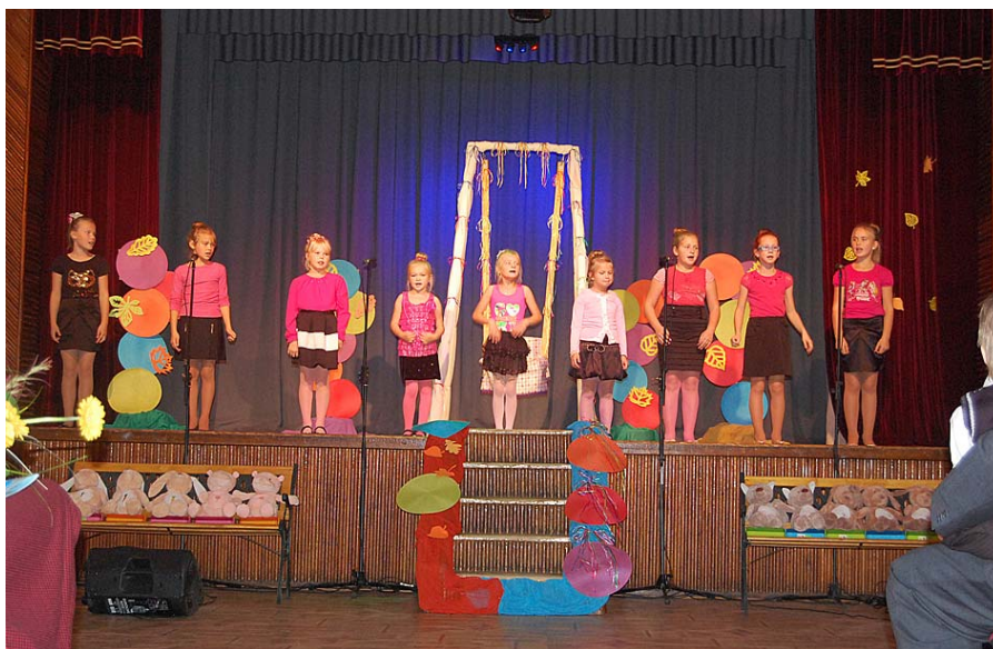
Degumnieku pamatskolas ansamblis.