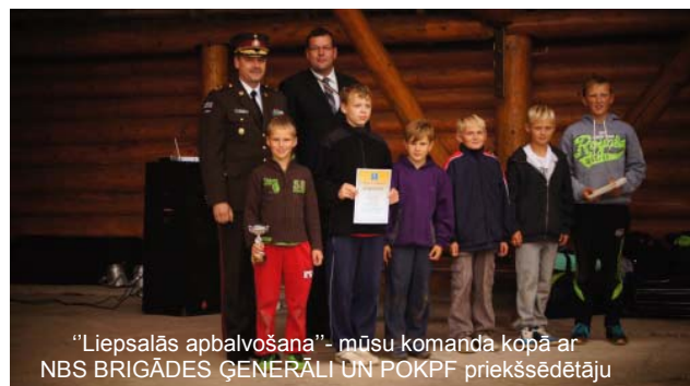
"Liepsalās apbalvošana"- mūsu komanda kopā ar NBS BRIGĀDES ĢENERĀLI UN POKPF priekšsēdētāju

11. un 12. septembrī norisinājās 17. Karoga svētki pulkveža Oskara Kalpaka dzimtas mājās „Liepsalās”, kur bija sapulcējušies vairāk kā 200 dalībnieku. Šo karoga svētku moto - „Drosmīgajiem - gara spēks un fiziskais rūdījums!”. Pasākumā notika militārā, sportiskā un tūrisma rakstura nodarbības un komandas ierindas mācība, ko nodrošināja NBS, viktorīnas par Latvijas vēsturi, loģikas un prāta spēles. Naktstrasīte ar orientēšanās, vieglatlētikas, sporta spēļu elementiem. No mūsu skolas piedalījās četras komandas - "Jaunsargu" komanda, "Degumnieki 1", "Degumnieki 2" un "Degumnieki 7-9". Divas komandas ieguva godpilnās otās vietas: komanda "Jaunsargi" un komanda