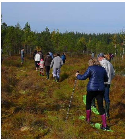
Pārgājiens pa purvu.

Lubāna mitrājs ir viena no putniem bagātākajām vietām Latvijā, kā arī nozīmīga putnu ligzdošanas un caurceļojošo ūdensputnu atpūtas un barošanās vieta. Tas ir lielākais iekšzemes mitrājs Latvijā, kur pavasara migrāciju periodā vienlaicīgi uzturas vismaz 23 000 ūdensputnu. Raudzīsim, ko labu šogad spēsim ieraudzīt