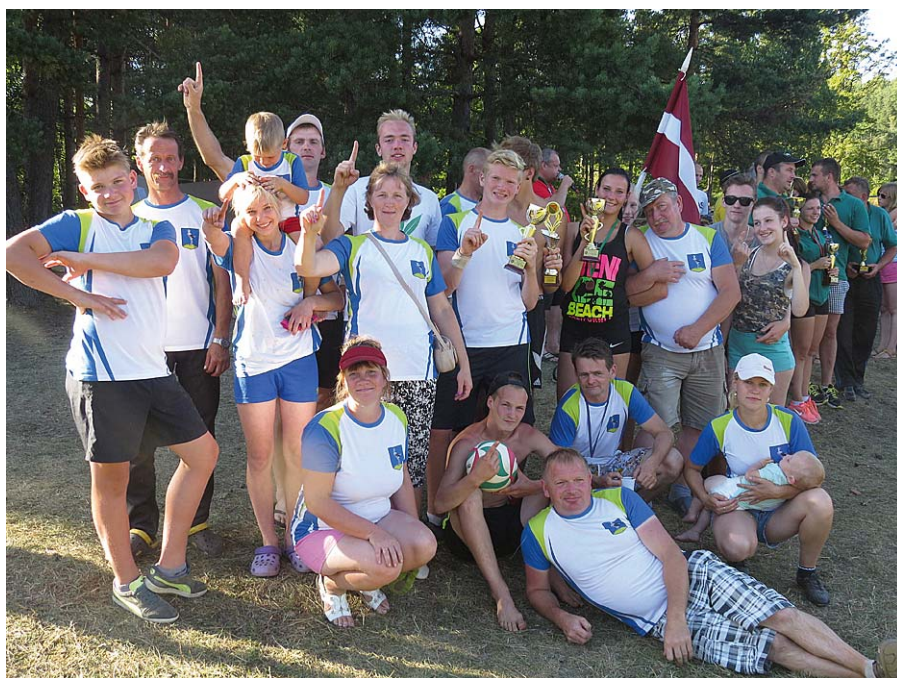
Ošupes pagasta pārvaldes komanda pēc apbalvošanas.

Paldies visiem sportistiem, kas tik pašreizējīgi aizstāvēja Ošupes pagasta vārdu. Veiksmi un izturību arī nā-