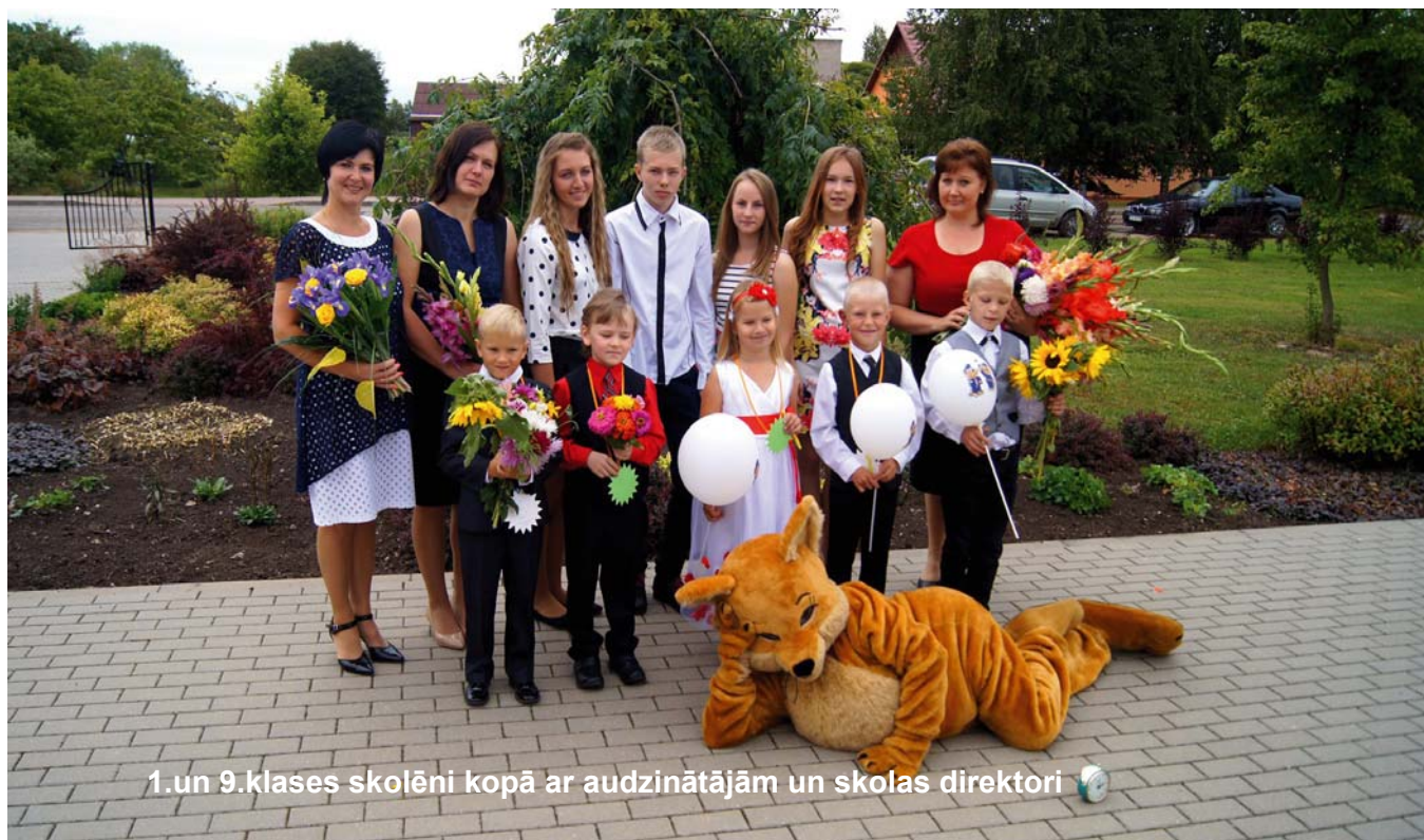
1.un 9.klases skolēni kopā ar audzinātājām un skolas direktori