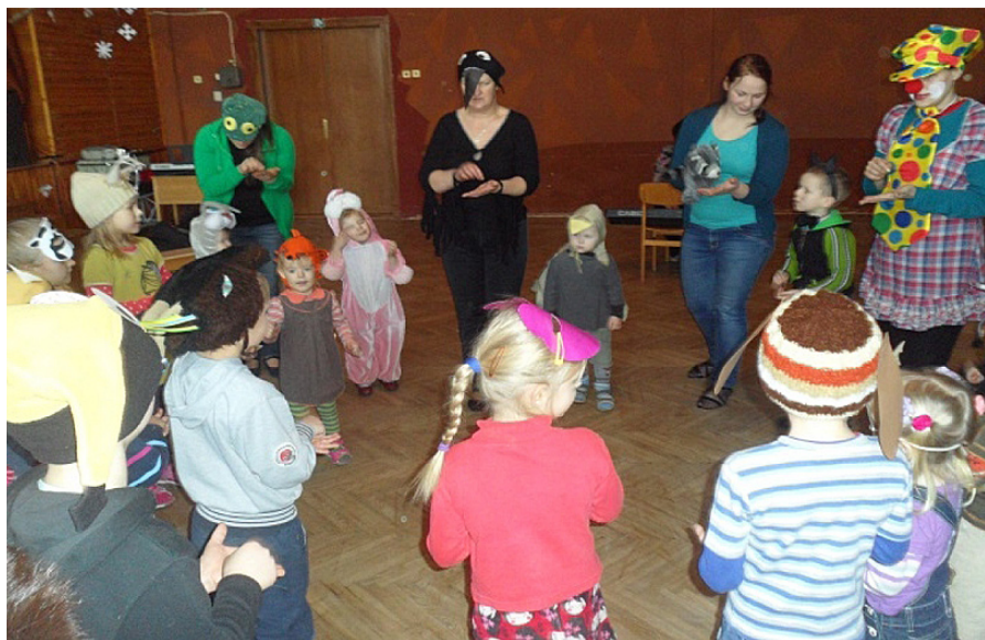
Mazie un lielie pirmsskolēni jautrā rotaļā „Karnevālā pie Bimbo”.