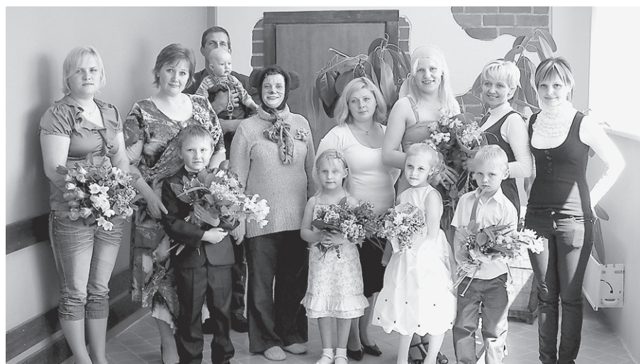
Nākamie pirmklasnieki kopā ar vecākiem un skolotājām.