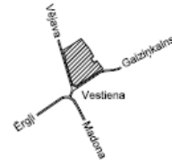
ZEMES VIENĪBAS IZVIETOJUMA SHĒMA