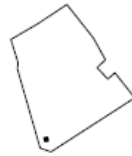
APBŪVES ZEMES IZVIETOJUMA SHĒMA ZEMES VIENĪBĀ