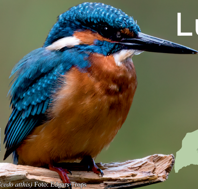
Zivju dzentis ( Alecco atthis )