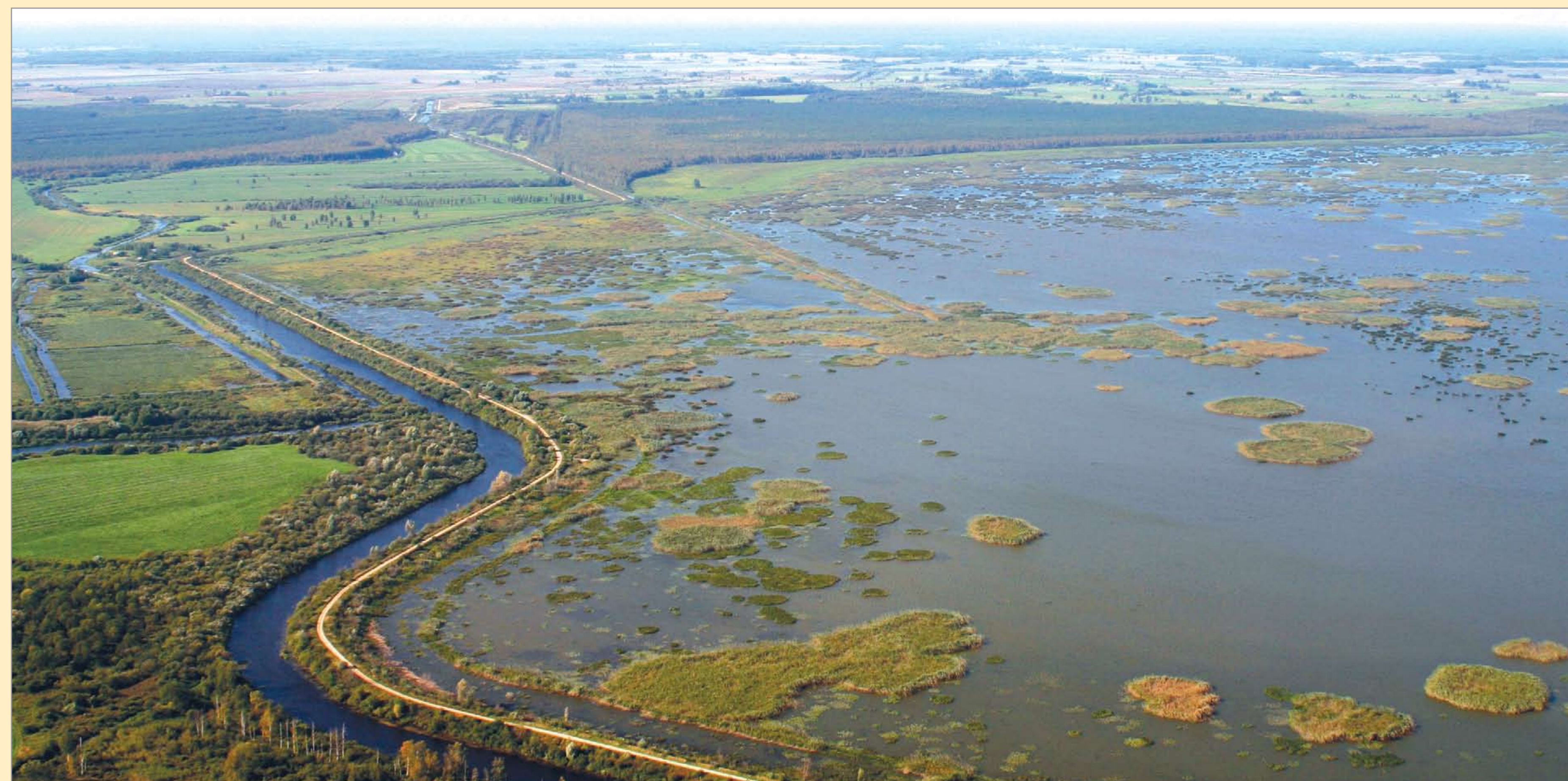
Lubāna ezera dienviņu daļa.