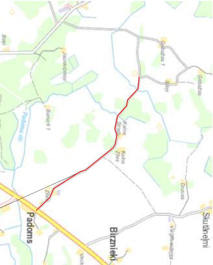
Objekta atrašanās vieta

ZMNĻ Tehniskie noteikumi Nr. L-1-30/484 VAS " Latvijas Valsts ceļi" tehniskie noteikumi Nr. 4.5.7.-272 AS "Sadales tīkls" Tehniskie noteikumi Nr. 30EFF60-06 06/961 SIA "Latelecom" Tehniskie noteikumi Nr. 37.8-10/0831 AS Augstsprieguma tīkls tehniskie noteikumi Nr. 50SA10-02-1994 Vispārīgie būvnoteikumi; Autoceļu un ielu būvnoteikumi; Būvniecības likums; LBN 224-15 „Meliorācijas sistēmas un hidrotehniskās būves”; LR MK noteikumi Nr. 550 „Hidrotehnisko un meliorācijas būvju būvnoteikumi” LVS 190 - 1 „Ceļa trase”; LVS 190 - 2 „Ceļu projektēšanas noteikumi. Normālprofil”; LVS 190 - 3 „Ceļu projektēšanas noteikumi. Vienlīmeņa ceļu mezgli” LVS 190 - 5 „Ceļu projektēšanas noteikumi. Zemes klātne”; LVS 77-1 „Ceļa zīmes. 1. daļa: Ceļa zīmes”; LVS 77-2 „Ceļa zīmes. 1. daļa: Uzstādīšanas noteikumi”; LVS 77-3 „Ceļa zīmes. 1. daļa: Tehniskās prasības”; Rokasgrāmata „Autoceļu nestīngo segu projektēšana”; „Ceļu specifikācijas 2015”;