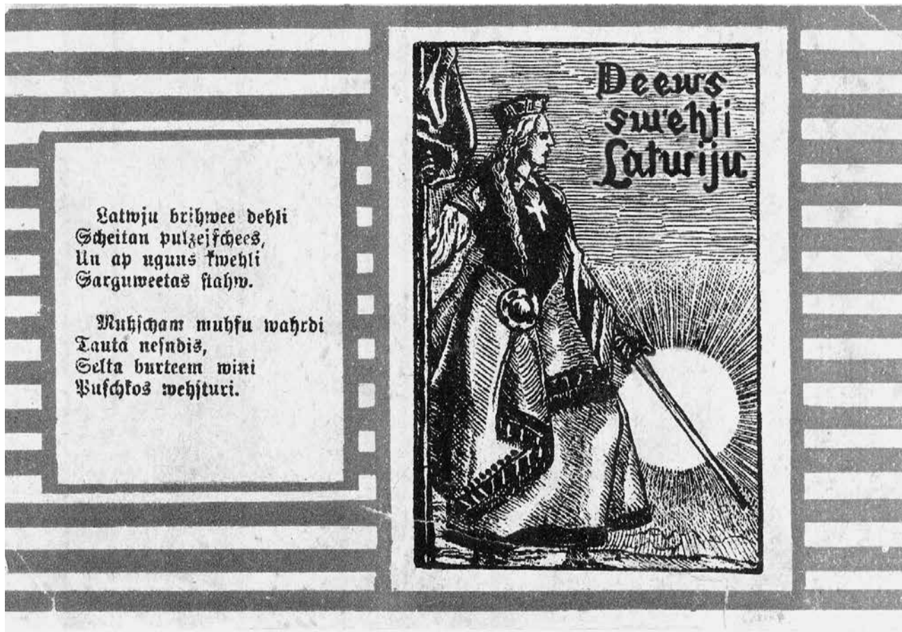
Atklātne no Madonas muzeja krājuma. Sūtīta 1918. gadā.

Viens no trim valsts simboliem ir himna – pacilājoša, svinīga slavinājuma dziesma. Termins “himna” cēlies no sengrieķu vārda “hymnos” – “aust”.