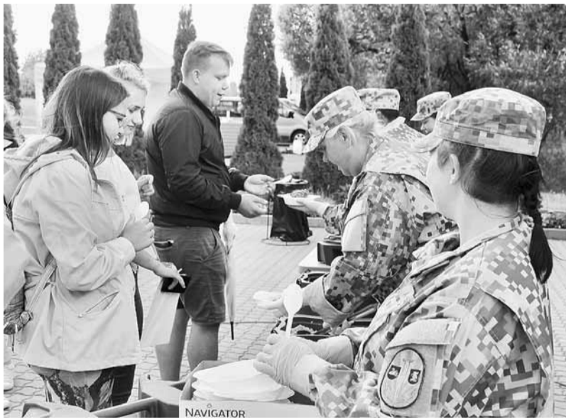
Zemessargu sarūpētās pusdienas.