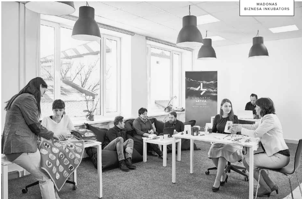
Biznesa inkubators ir kopienas vieta, kur esošajiem, jaunajiem un topošajiem uzņēmējiem satiekies, saņemt konsultācijas, atbalstu un darboties kopradē.