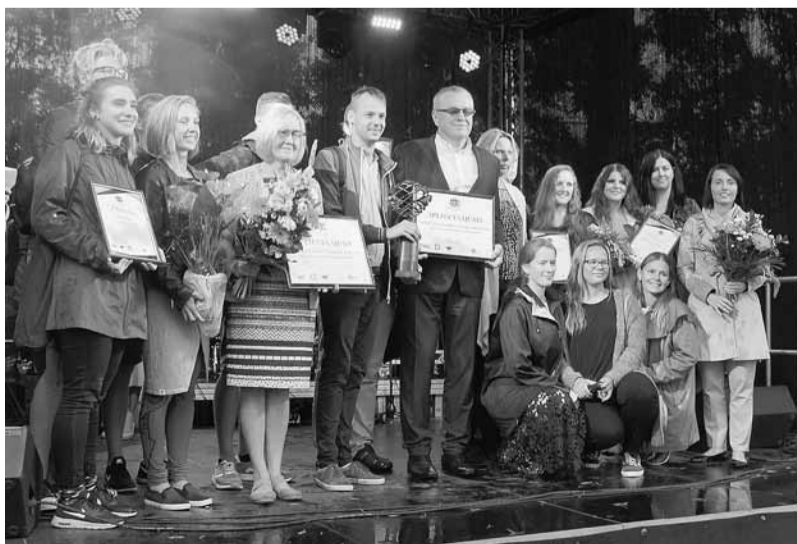
“Latvijas Jauniešu galvaspilsēta 2019” titula ieguvēji – Ikšķiles un Olaines novadu apvienība.