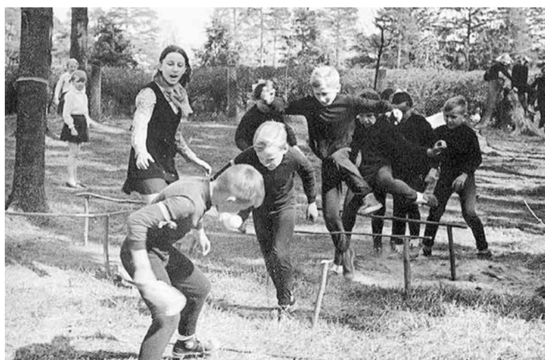
Stafetes skrējiens šķēršļu joslā estrādes kalnā Madonā. 1971. gada maijs.