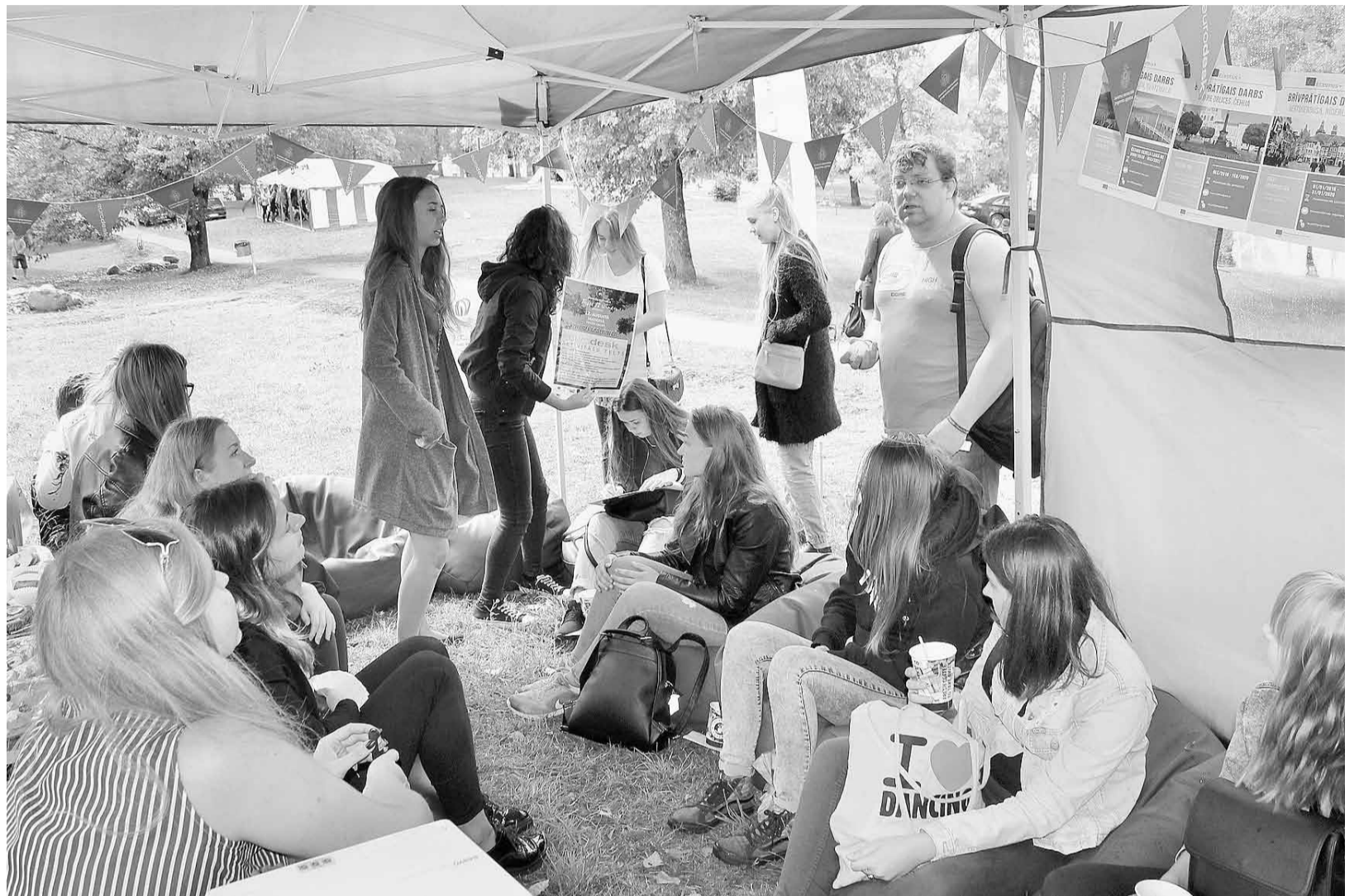
Jaunatnes starptautisko programmu aģentūras aktivitāšu teltī norit spraigas diskusijas.