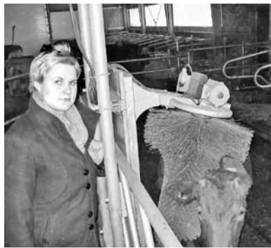
Brūnajām patīk jaunā glaudīšanas iekārta.

„Eglišu” ganāmpulkam – Eiropas līmeņa novietne