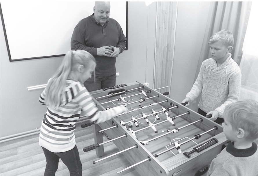
Aktivitātes piemērotas dažādu vecumu cilvēkiem.