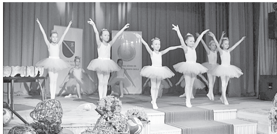
Pasākumu atklāja Madonas KN klasiskās dejas pulciņa dalībnieces.