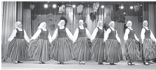
“Kalnagravu” dejotājas prezentē audēju veikumu.