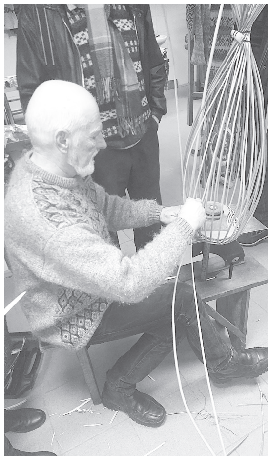
Meistars dalās savā pieredzē.

gan pieredzē, gan praktiski rādīja un pamācīja pīšanas tehniku. Smēlāmies jaunas idejas un iedvesmu turpmākajam darbam. Ceļamaizei meistars dāvāja pa klūdziņu buntei.