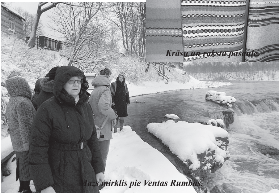
Ļaus mirklis pie Ventas Rumbas