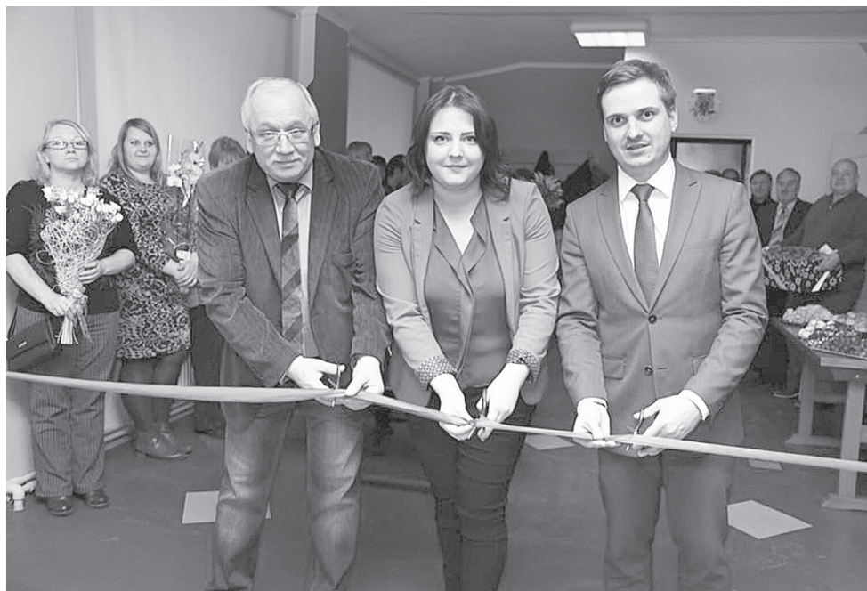
Konkrēts posms sadarbībai, pagasts – multifunkcionālais centrs – novads, noslēdzies.

Multifunkcionālais centrs „Logs” ir pulcēšanās vieta visu paaudžu Sarkaņu pagasta iedzīvotājiem un tā viesiem.