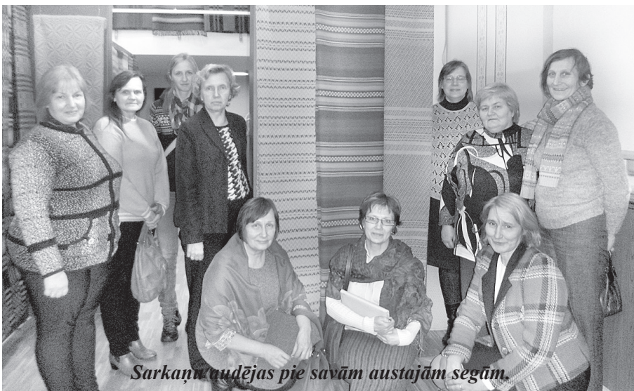
Sarkaņu audējas pie savām austajām segām