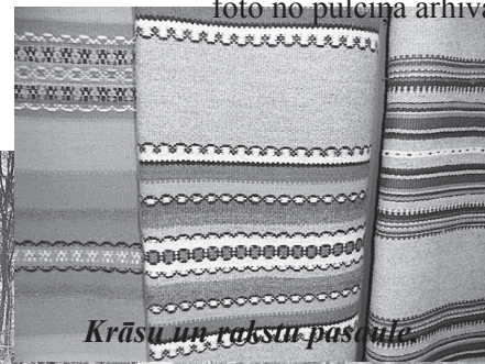
Krāsu un rakstu pasaulē