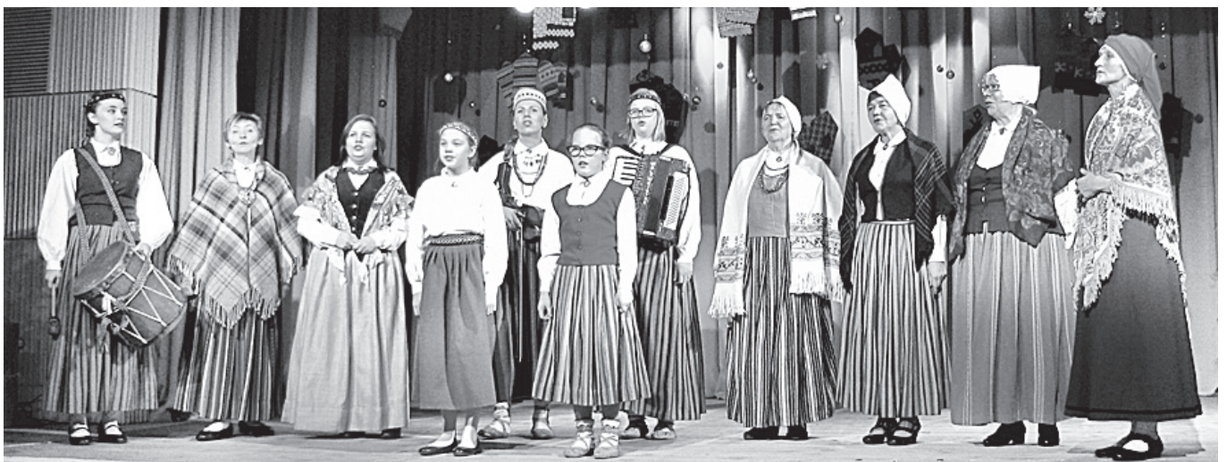
Folkloras kopa “Libe”.