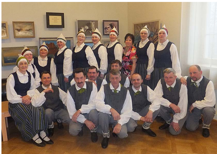
„Mētra” pēc skates.