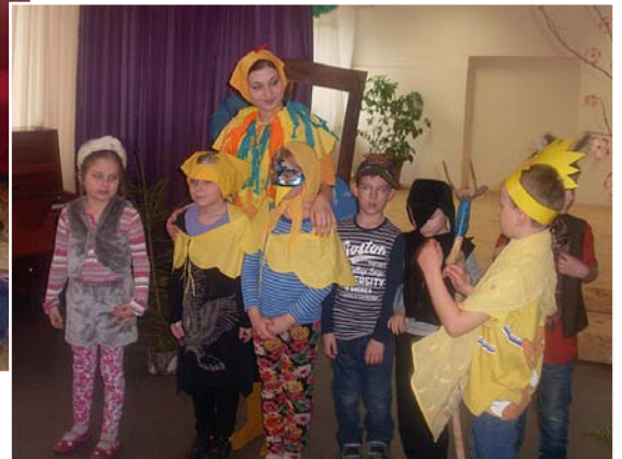
Ciemos bija atnākusi Vistiņa.

par skolēnu tiesībām, reti kad domājam par pienākumiem.