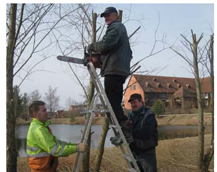
Darbi parkā pie Piemiņas akmens.

Ilmārs Grudulis Melitas Grudules un Solvitas Stulpiņas foto