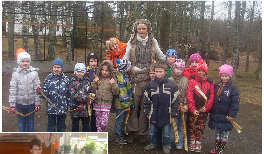
Kopā ar Lieldienu Zači.

Atcerējos un mēģināju salīdzināt darbu skolā tagad un pirms sešdesmit gadiem, kad es strādāju par skolotāju. Atšķirības un izmaiņas ir. Skolēniem savas prasības, skolotājiem savas. Bieži dzirdam