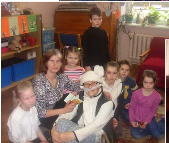
Kopā ar Galveno Lieldienu Zaki.