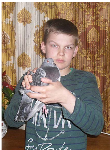
Rinalds ar savu balodi.

Balodi atradu vārgu un nosalušu netālu pie skolas, pretī ūdens tornim, 2014. gada novembrī. Balodim pat nebija īsto spalvu, viņu klāja dūnas. Pacēlu viņu rokās, sasildīju, parādīju klasē pārējiem un skolotājam. Izteicu vēlēšanos viņu aprūpēt un nest uz māju. Atnesu mājās, mājnieki bija pārsteigti par manu domu noņemt ar tik vārgu putnēnu. Pēc pāris dienām viņš palika drošāks, iepazīnās ar apkārtni. Vismīļāko vietu viņš izvēlējās krāsns augšu virtuvē. Internetā izlasijām visu par baložiem, par barību, dzīvesveidu. Balodis drīz sāka līdināties virtuvē, atrada viņam nolikto barības trauku, ūdeni, iepazīnās ar pārējiem mūsu mājas dzīvniekiem – ar veco sunēni, kas vairs labi nedzird no vecuma, ir neliela auguma un viņas guļas vieta ir virtuvē zem galda