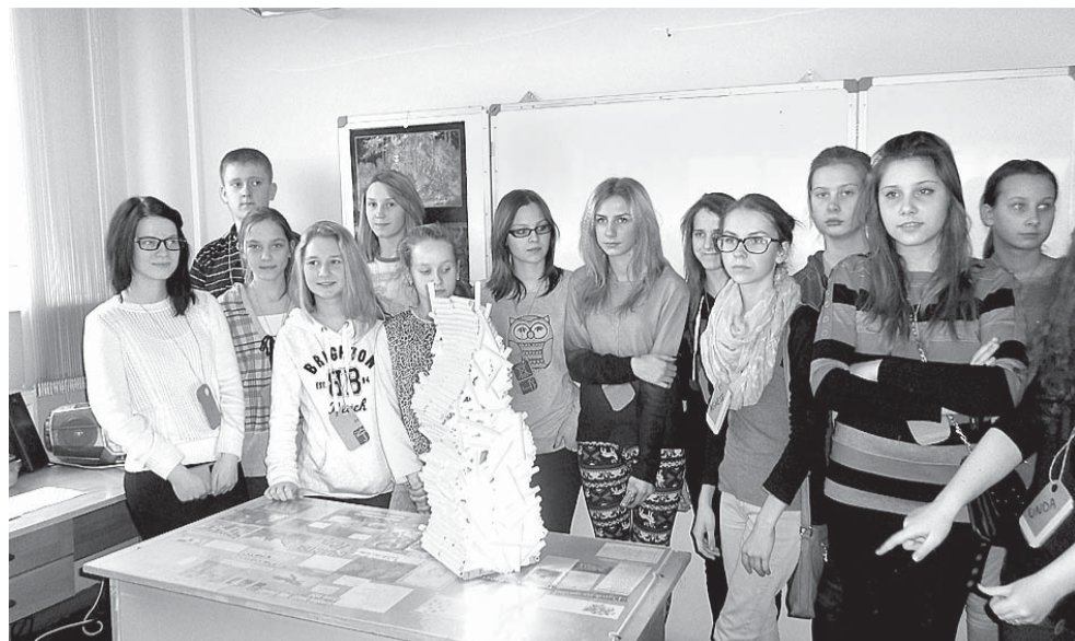
Kad darbs padarīts

Forumā pēdējā dienā notika ekspedīci-ja mežā, lai svaigā gaisā pārdomātu gūtās zināšanas un atcerētos visu piedzīvoto.