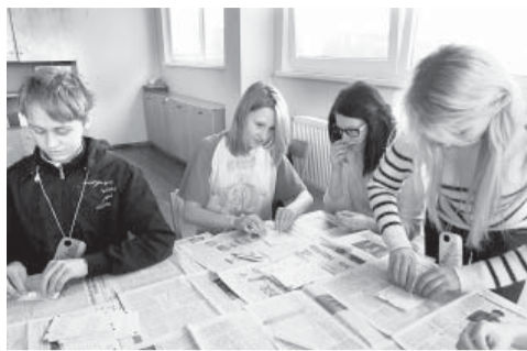
Papīra lampas gatavošana