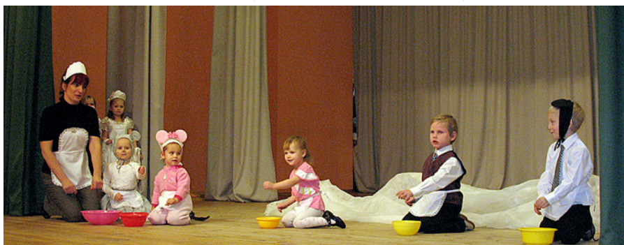
Spēlējam teātri tautas namā.