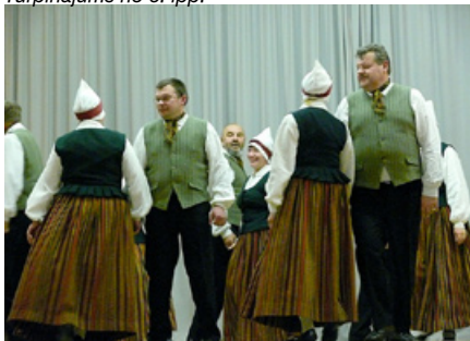
Dejo Kalsnavas pagasta senioru deju kolektīvs