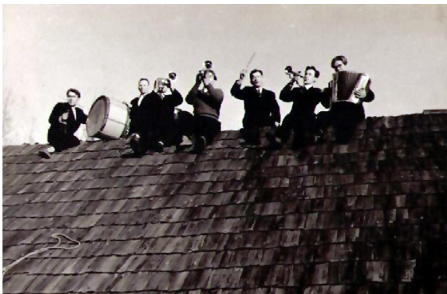
Muzikanti spēlēja pat uz šķūņa jumta.