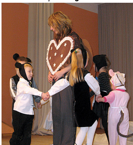
Arī pelēniem garšo piparkūkas.