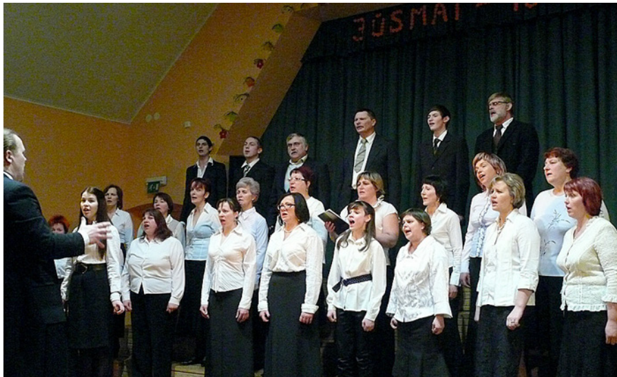
Dzied Praulienas pagasta jauktais koris.

Prieks par dziedošiem un dejojošiem viesiem – Praulienas kori un Jāņukalna dejojājiem. Prieks par pilno skatītāju zāli. Prieks un aizkustinājums līdz asariņai par