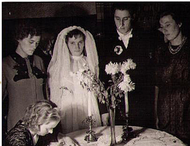
Svinīgais brīdis pirms piecdesmit gadiem.