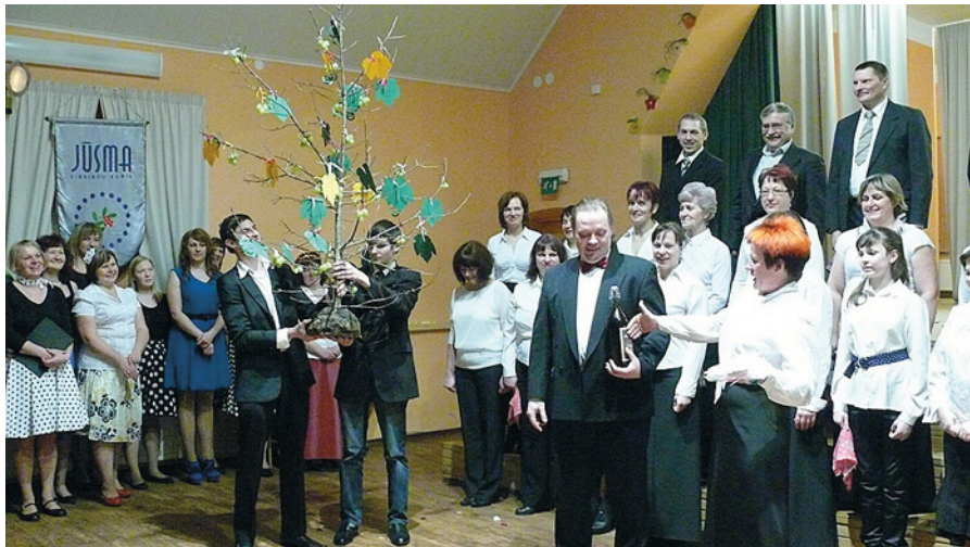
Dāvanas vienmēr patīkami saņemt.