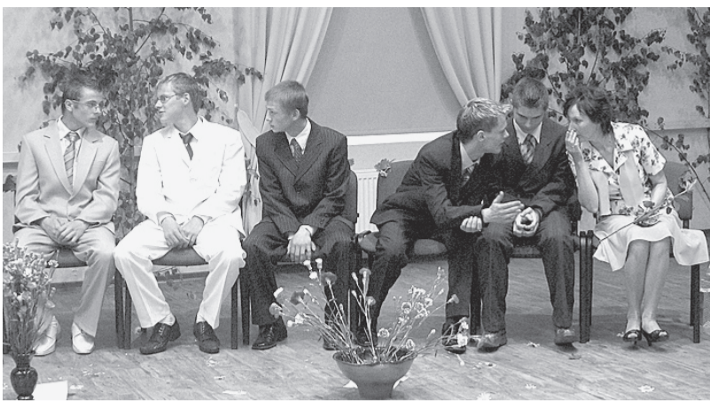
Vēl pēdējie norādījumi...