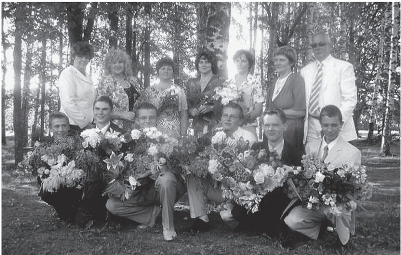
Mirkļis kopā ar skolotājiem un pagasta pārvaldes vadītāju.