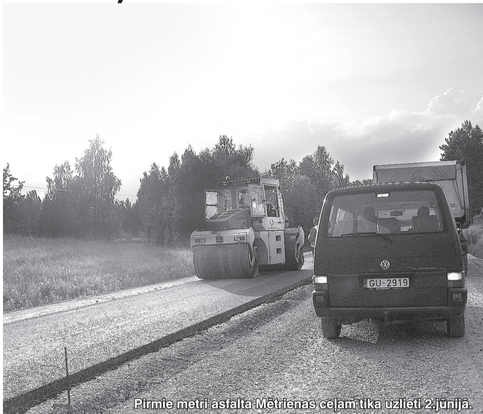
Pirmie metri asfalta Mētrienas ceļam tika uzlieti 2.jūnijā.

Mētriena būs glauna vieta, Te nokļūt nebūs joka lieta – Par iebraukšanu Mētrienā, Pie robežas lats jāmaksā!