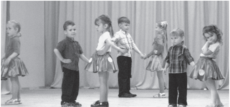
Absolventus sveica pirmskolas grupiņas dejojāji un sākumskolas skolēni.