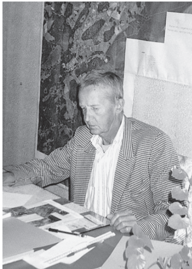
Pirms aiziešanas pensijā 2009. gada jūlijā. Darba stāžs 49 gadi 11 mēneši.

nodedzinot tautas namu, pagasta ēku un tagadējo „Riekstiņu” māju. Skats bija baigs. Uzliedzumu laikā slēpāmies Valtersalā zemniecās. Skrienot, māte mūs veda katru pie savas rokas, kad sākās uzliedzumi, pati uzglūlās mums virsū, tā mēģinot mūs pasargāt... Pēckara gadi bija smagi. Sapratām, ka bez darba nekā nevar būt. Katrs ir pats savas laimes kalējs.