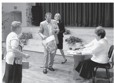
Vecāku paldies skolotājiem un pagasta pārvaldei.

Absolventu domas apkopojā Solvita Stulpiņa